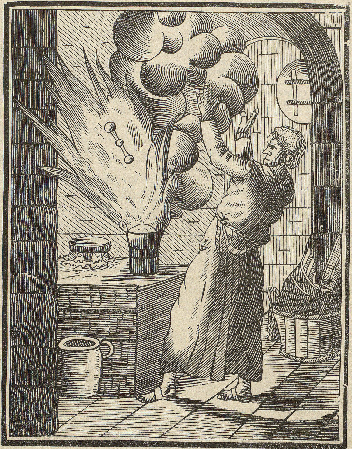
Berthold Schwarz, der Erfinder des Schießpulvers. Geschnitten im Jahr 1788 von Math. Sturzenegger, Mathemat.