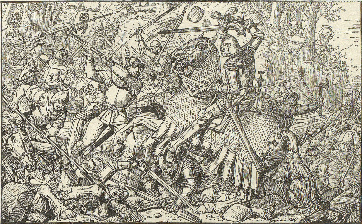
Im nächsten Augenblicke ließ er sein Schwert fallen und schwang seine Streitart mit beiden Händen.

diesen da verdanke ich heute eine vermehrte Kunst. Ich bin meiner Lebtag nie so gut und so schnell gesprungen, wie heut und schon aus diesem Grunde zählt stets auf meine Dankbarkeit.“ Lachend reichte er auch den Andern seine Hände und bald vermischten sich die beiden Gruppen; die St. Galler holten Proviant aus ihren Beuteln und lustig kreisten die Becher.