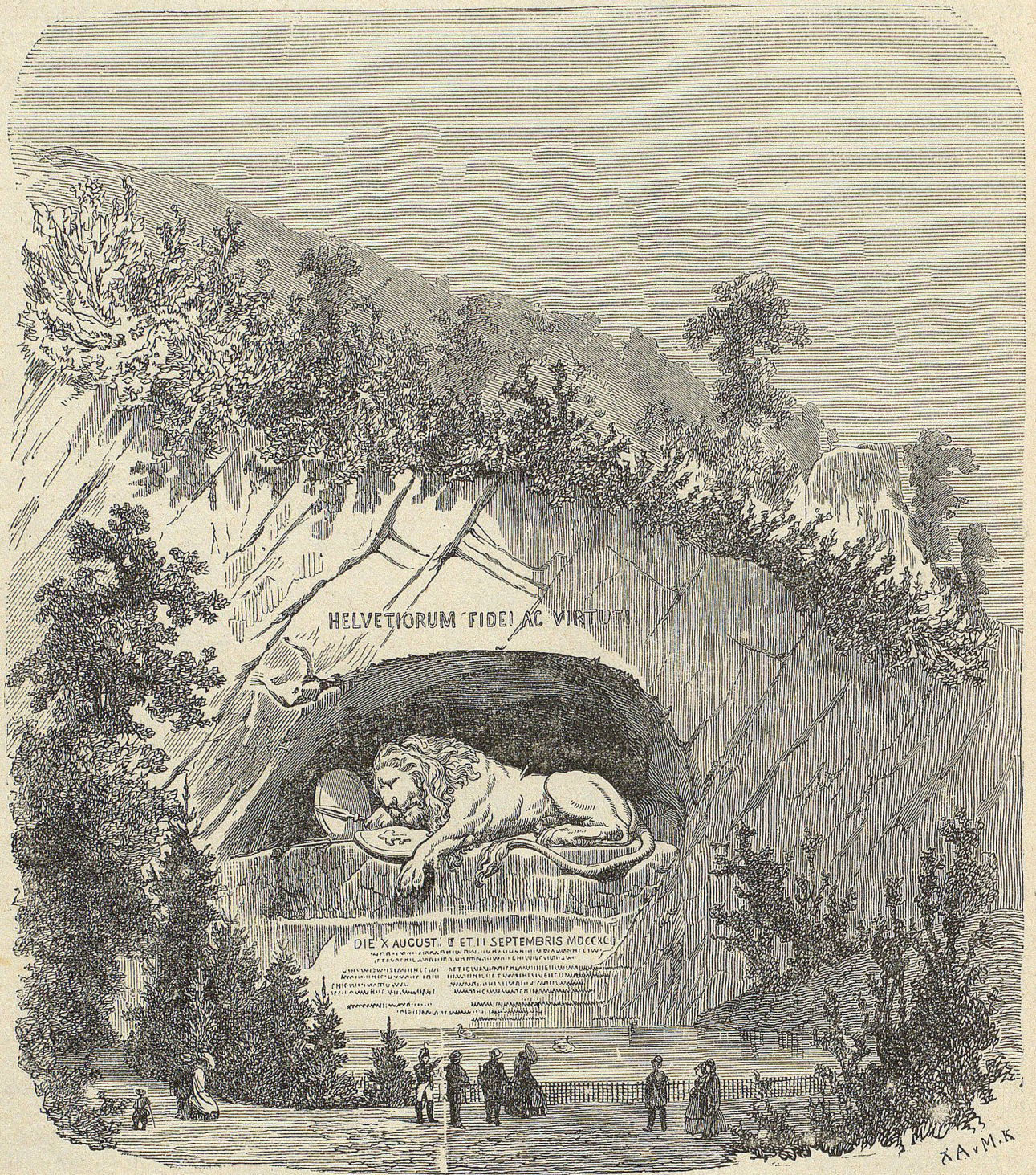
Das Löwendenkmal in Luzern.