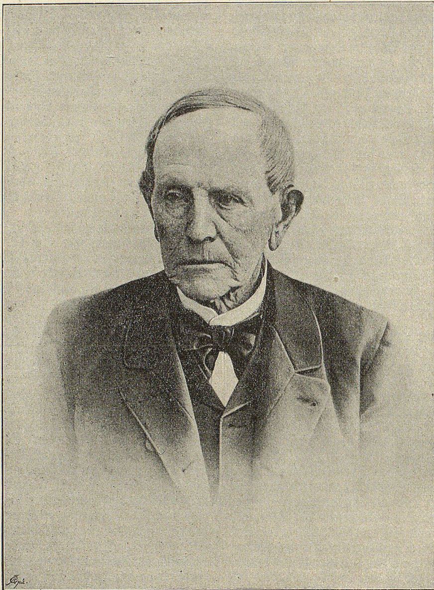
M o s t f e.

Rüthi und Moos wird jedenfalls der Betrag des Jahres 1890 noch lange in Erinnerung bleiben. Denn an diesem Tage brach bei wüthendem Föhnsturm Feuer im Dorfe Rüthi aus. Trotz sofortigen Eingreifens der Mannschaft verbreitete sich das rasende Element furchtbar schnell und der Föhnsturm trieb den Funkenregen eine halbe Stunde weit zum Dörfchen Moos. Wohl eilten aus dem Rheinthale, vom Oberlande, ja selbst aus der Stadt St. Gallen und aus dem Oesterreichischen Spritzen in großer Zahl herbei. Aber gegen das vom Föhnsturm angefachte Nie-