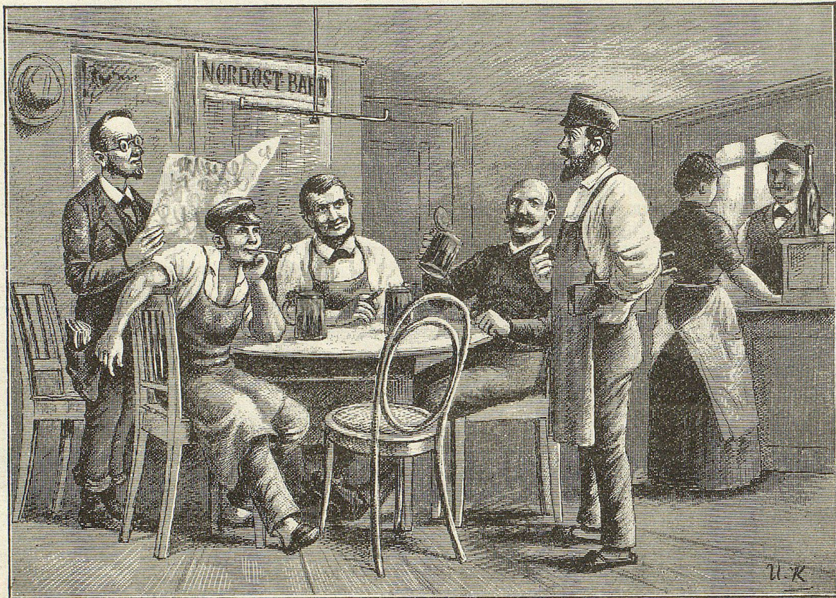
Jetzt springt er uf und rüeft: „Da ist en infame Schwindel! E derigs Inserat stoht nid im Tagblattinne!“

Jetzt isch es uf emol ganz firlech still worde im Lokal. De Meisterer stoht uf, nimmt d'Chappe ab, goht uf de Höbéli zue und git ehm d'Hand: "Mejeri Fründ und Kollege hend mir de ehrevoll Uftrag ertheilt, Dir im Name vu der ganze Gesellschaft zu der Vergrößerig vu Dim Geschäft z'gratuliere, mit dem