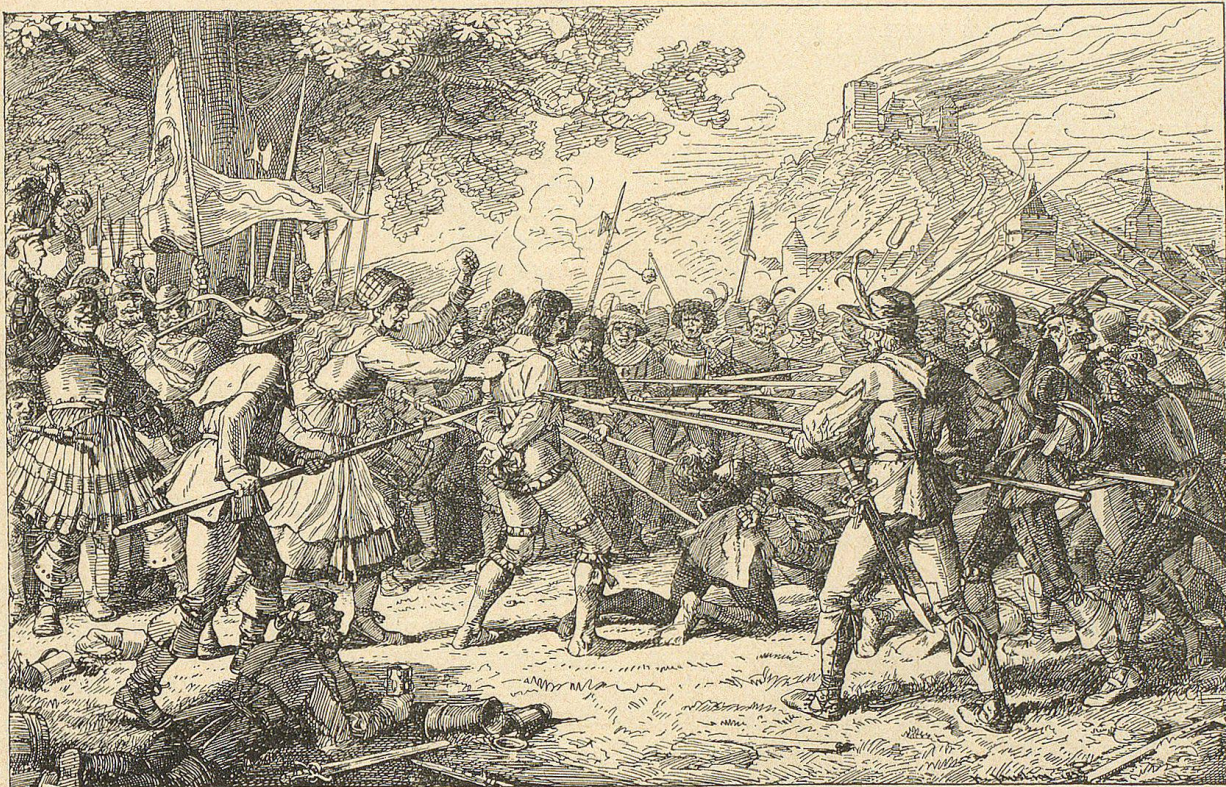
„Hinein zwischen die Spieße mit ihnen!“ brüllte der dicke Wirth von Irding

Weiter durch die deutschen Gaue wogte der Aufstand, mit jeder Stunde wachsend. Nicht blos Bauern