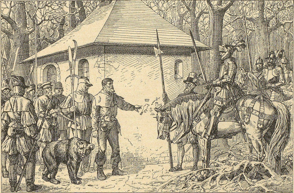
Dann zeigte der Bärenführer auf die einzelnen Zeichen.

Der Fremde trat neben den Truchseß und warf nur einen einzigen Blick auf die rothen Figuren auf dem Mauerwerk. Dann leuchtete es in seinen Augen hell auf von böshafter Freude und er sagte in fremdartig klingendem Dialekt: „Ich will die hundert Gulden verdienen und mir vollständige Straflosigkeit und zudem noch den Dank des hohen Herrn sichern.“