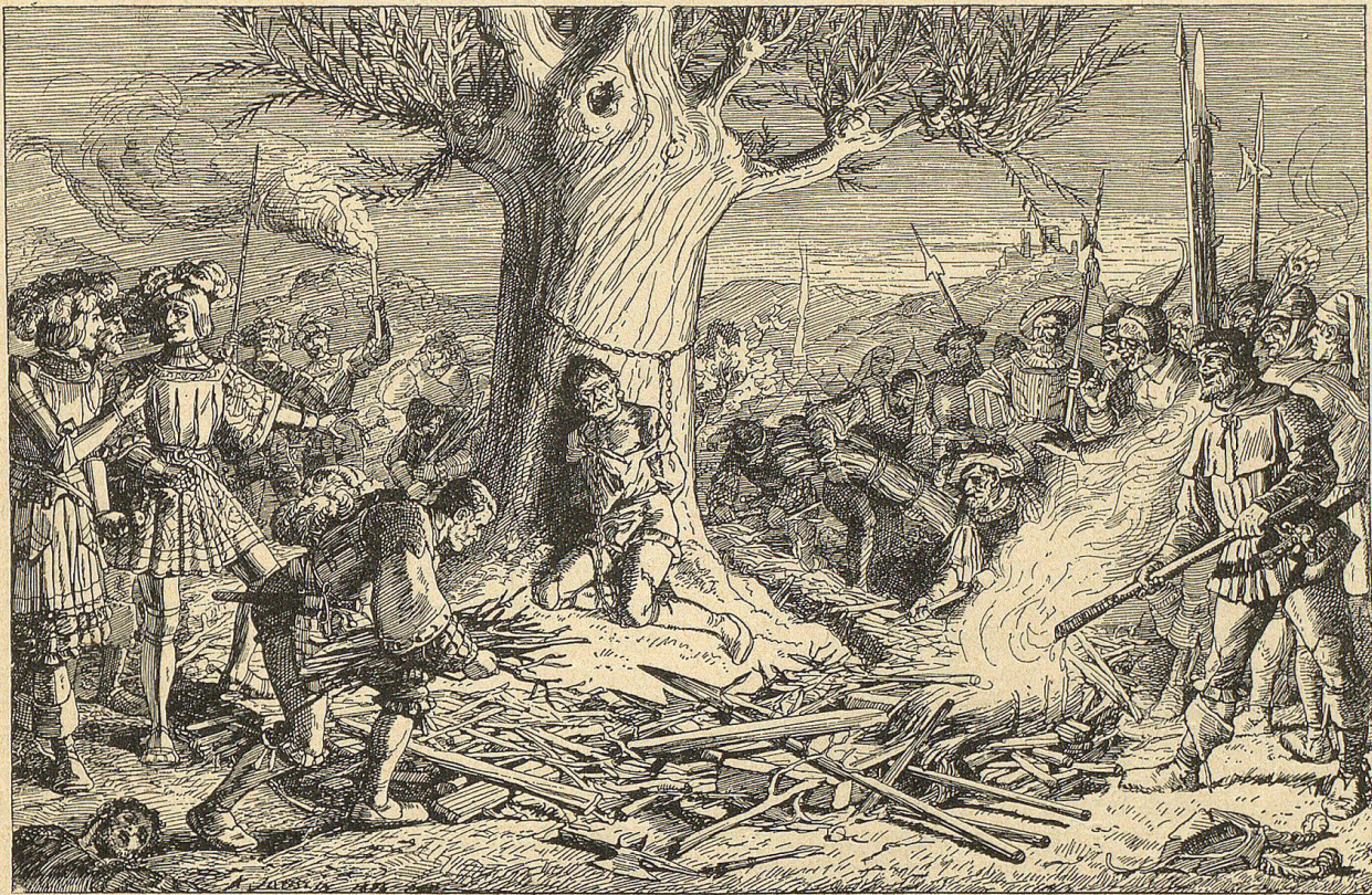
Eine Fackel senkte sich. Das dürre Reisig prasselte und fing Feuer.

„Hilfe! Hilfe!“ kreischte das Opfer grausamster Rache und der Schrei gellte weit in die Nacht hinaus.