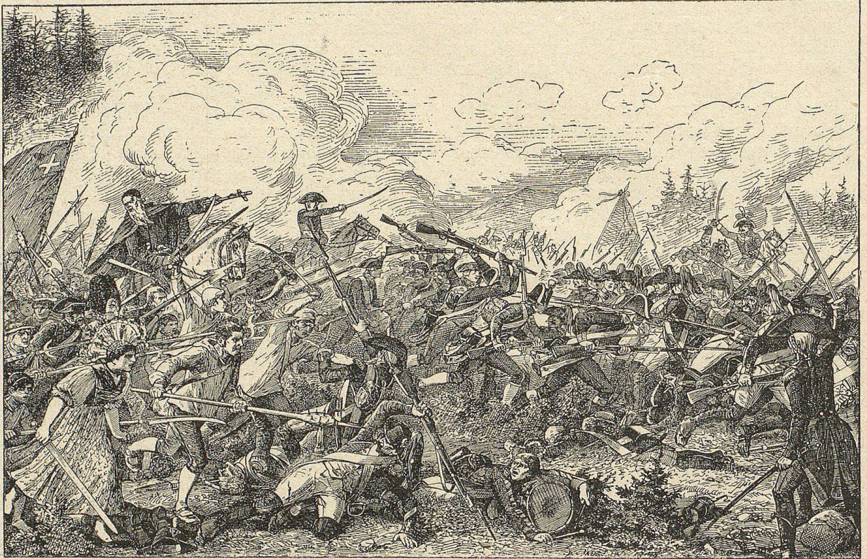
Paul Styger und Alois Reding.

Am andern Tage bewegten die Franzosen sich gegen Einsiedeln. Die Schwyzer stellten ihre Hauptmacht unter Reding an der Schindellegi auf. Inzwischen hatte Glarus kapitulirt. Die Buzüger aus der Ostschweiz entfernten sich, die Unterwaldner,