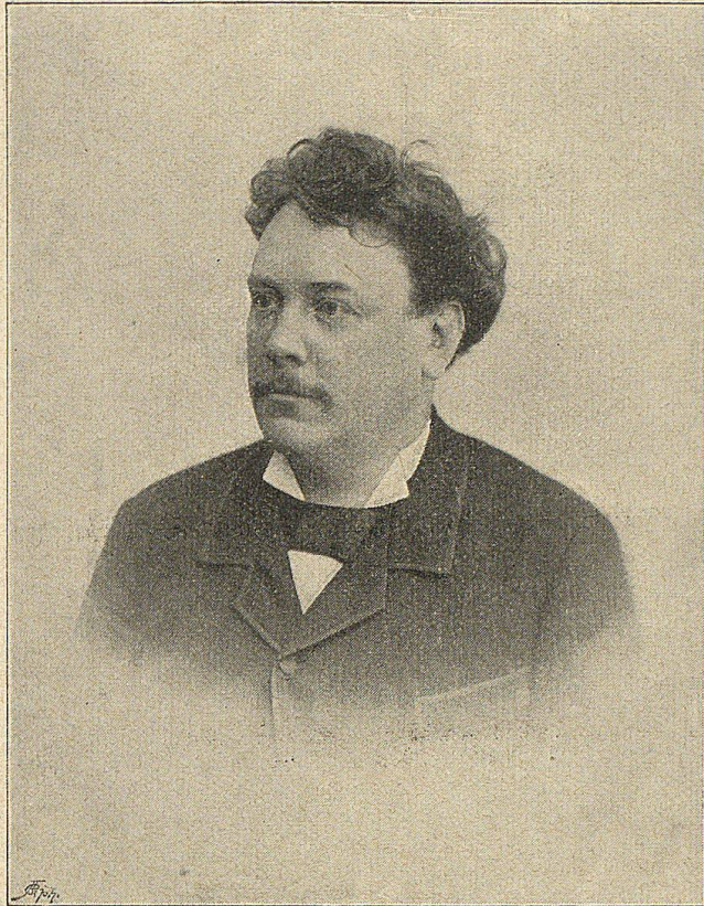
Bundesrath M. Ruchet von Ver.

Sitten macht unheimliche Fortschritte. Eine Besserung hofft man durch die Heirath des österreichischen Thronfolgers Franz Ferdinand mit der Gräfin Chotel, einer Dame aus dem böhmischen Hochadel. Dadurch nähert sich ein alter Traum der Böhmen der Erfüllung, einmal eine Frau ihres Stammes auf Oesterreichs Kaiserthron zu sehen. Wenn das Ereigniß eine Aussöhnung mit Böhmen zur Folge hätte, könnte man Oesterreich dazu beglückwünschen, trotzdem alle Hoffschranzen der Welt darüber die Nasen rümpfen. Das schöne Oesterreich! Es hätte sonst alle Vorbedingungen, ein glückliches Land zu sein!