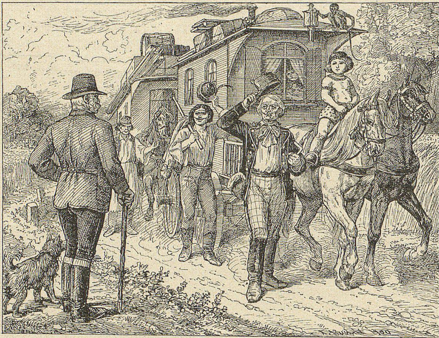
Vorne schritt der Direktor der Truppe. Ein alter, hagerer Mann mit von Kummer durchfurchtem Gesichte.

„Die Leute glauben immer, wir Bauern seien auf Rosen gebettet und jedes gute Jahr bringe uns einen unvorhergesehenen Reichtum.“