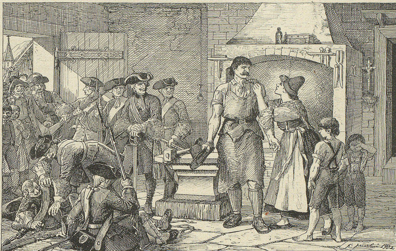
„Tröst' ich Gott unterdessen, spätestens übermorgen bin ich wieder bei Dir und den Buben“, sprach er.

blaue Kinderaugen, hell wie Stahl. Wenn er den Arm erhob mit einer Geberde der befriedigten Kraft, da fühlte man es, daß ihm das leicht von staten ging, was Andere harte, anstrengende Arbeit nannten. Der Schlag seines Hammers durchdröhnte die dörrliche Stille und den Frieden des Moores eine halbe Stunde weit, ähnlich dem Galopp einer sich allmählig annähernden geharnischten Schaar. Das offene Hemd ließ eine rauhe Brust sehen, deren Seitenrippen bei jedem Zug hervortraten. Er bog sich zurück, nahm einen Schwung und ließ den Hammer niedersausen. Und das ohne Stillstand, mit einem leichten, fortgesetzten Wiegen des Körpers, mit fester Anspannung der Muskeln. Er schmiedete eine Pflugschaar. Tok — tok — tok schallte es