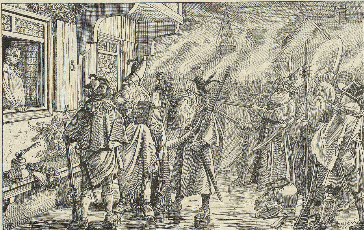
Der Habermeister, den Stab Karls des Großen in der Hand, schritt zum Namensaufruf.

Plötzlich wie auf ein gegebenes Zeichen trat di unten lautlose Stille ein. Der Habermeister, den Stab Karls des Großen in der Hand, schritt zum Namensaufruf. Er war