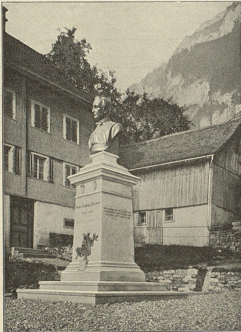
Zwißsig-Denkmal in Bauen.

Bauen ist ubrigens wohl eines Besuches werth,