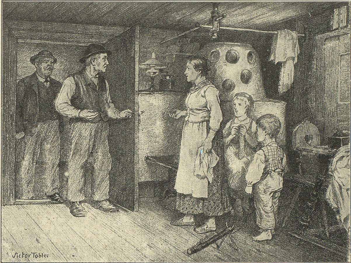
D's Biseli ist em ätgäget und seit früntli: „Gueten Abed, Vater, was bringt üch zueche?“

„Das mag si iez au verliibe, wäget füzg Jährlene“, seit der Hansjaaggli, da isch mä ja gad nuch i der Besti.