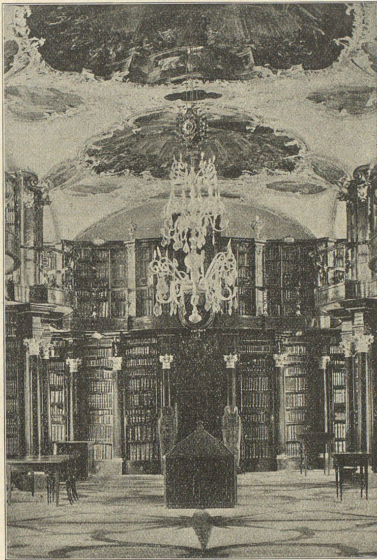
Die Stiftsbibliothek von St. Gallen.

Dem 18. Jahrhundert, das bereits das schöne Schiff der heutigen Kathedrale anstaunte, entsprach