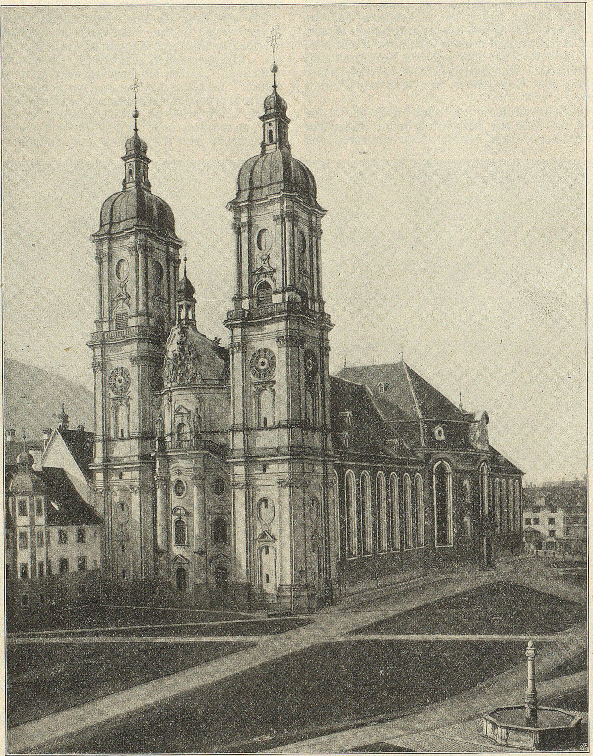
Die Kathedrale von St. Gallen.