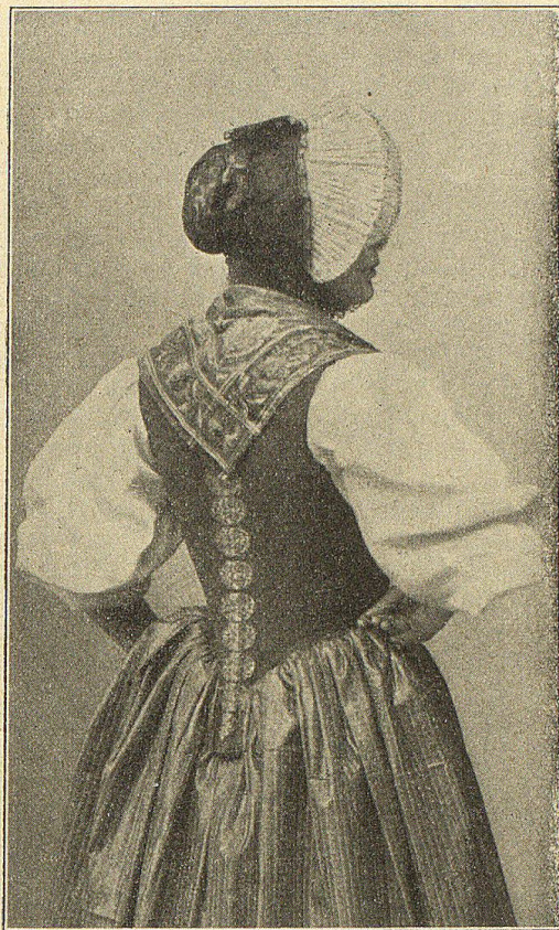
Rückenansicht des Niders und der Touffette.

Es war Mode, die weiten Röcke derart aufzunehmen, daß man sie mit den Ellbogen festhielt, indem man sie an die Hüften andrückte. Die ebenfalls aufgebauschte, dunkelfarbig gemusterte Schürze wird von den mit roten, langen Lederhandschuhen versehenen Händen mitsamt dem Kirchenbuch gehalten. Das Buch war mit Silber beschlagen. Allgemein dürften die Hemdärmel zu zwei Puffen mit schwarzen Sammetbändern unterbunden worden sein. Vom Nieder ist hier wenig sichtbar.