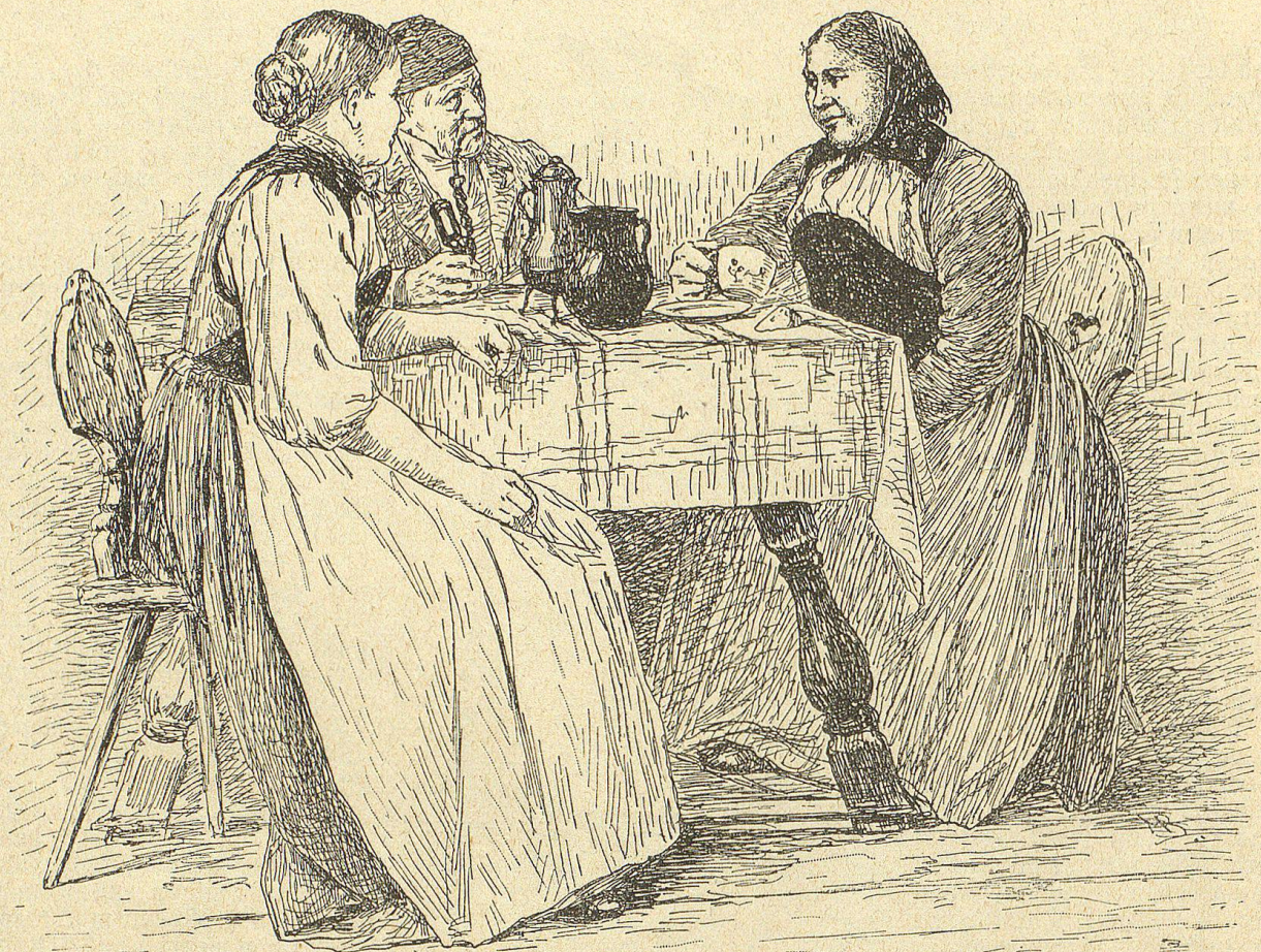
Die Glungenbäuerin, von einem Besuch aus der Stadt heimkehrend.

uns das prächtige Weib als reiche Bäuerin vorzustellen. Sie wird, aller irdischen Sorgen entledigt, als Gattin, Mutter und Leiterin eines großen Hausstandes ihre Gaben des Herzens zur reichen Entfaltung bringen können. Sie wird der Engel des