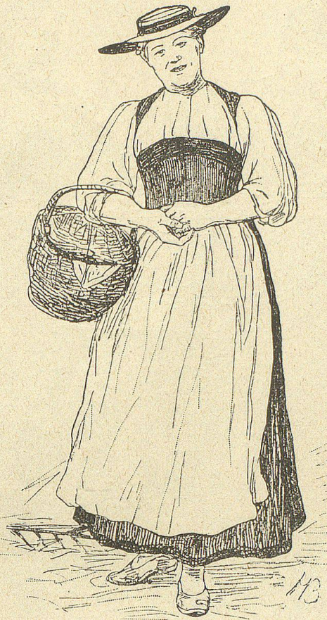
Breneli, Magd auf der Glungge.

Dieser reiche Bauer Hagelhans, der bisher in einem verlorenen Winkel des Emmentales sein Regiment