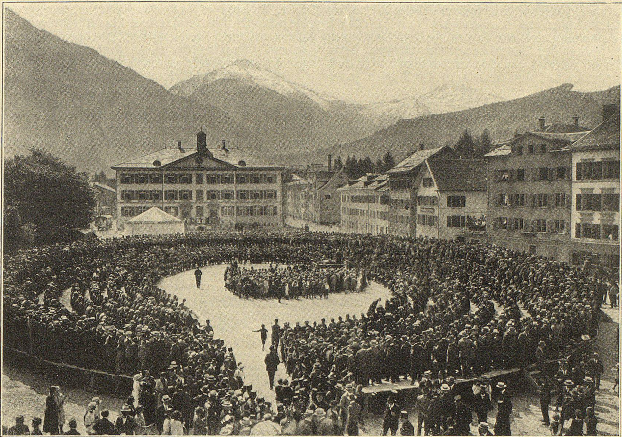
Die Landsgemeinde 1923 in Glarus (Blick in den „Ring“, im Hintergrund der Kärpfstock).

die Schweiz, der aber insofern ein Schlag ins Wasser ist, als unsere Wirtschaftsbeziehungen zum glorreichen Sovieterreiche längst gleich null sind und dies noch lange auch ohne Boykott bleiben würden.