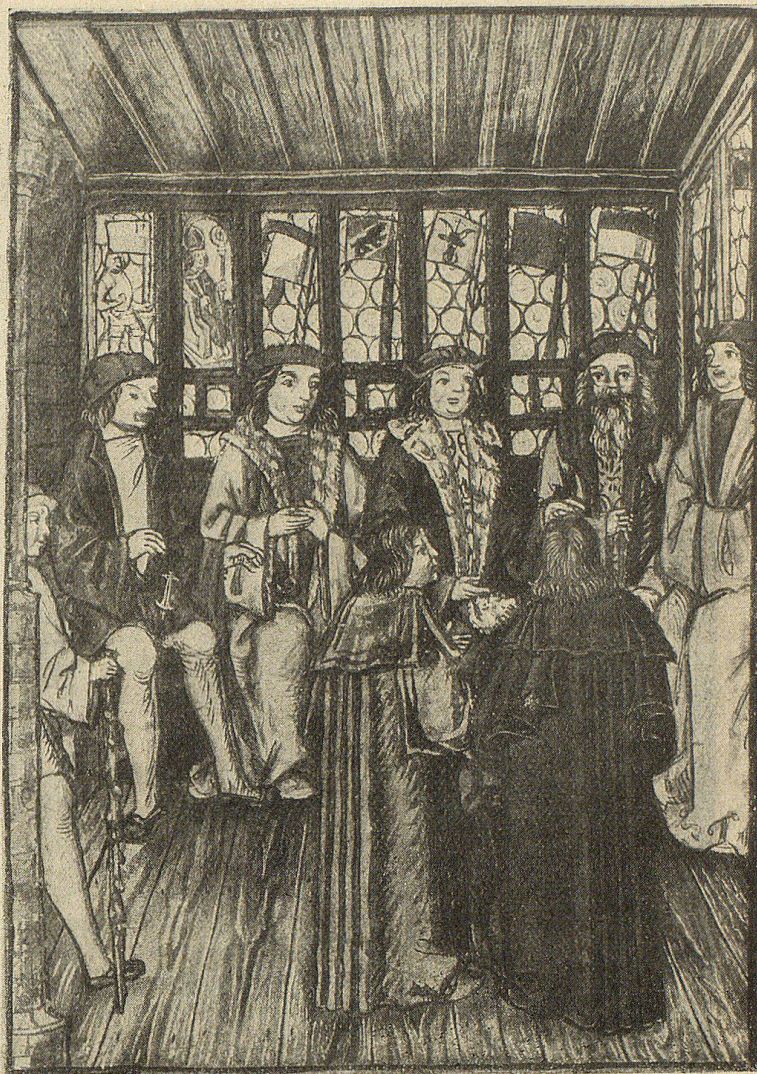
Abb. 2. Ratsstube in Luzern. Aus Diebold Schilling's Schweizerchronik im Staatsarchiv in Luzern.

Wange Zeiten der Not hatten die Eidgenossen zu Beratungen über die gemeinsame Abwehr drohender Kriegsgefahren zusammengeführt und darauf fröhlicher Festjubiläum sie nach den Tagen der Siege vereinigt. Wenn später die Eifersucht der Stände unter sich den politischen Himmel durch manche Wolke verdunkeln ließ, so schlossen dafür übermütige Fastnachtsfeiern und gemeinsame Schützenfeste die Bande gegenseitiger Freundschaft wieder umso enger. Dieses erwachende Bewußtsein der Zusammengehörigkeit aller Eidgenossen sollte nun aber auch sichtbaren Ausdruck erhalten, indem man sich gegenseitig die Wappenscheiben in die neuen Ratsstuben stiftete, sobald diese eine neue Befensterung mit Wappenscheiben erhalten hatten. Die künstlerische Form, in welche man