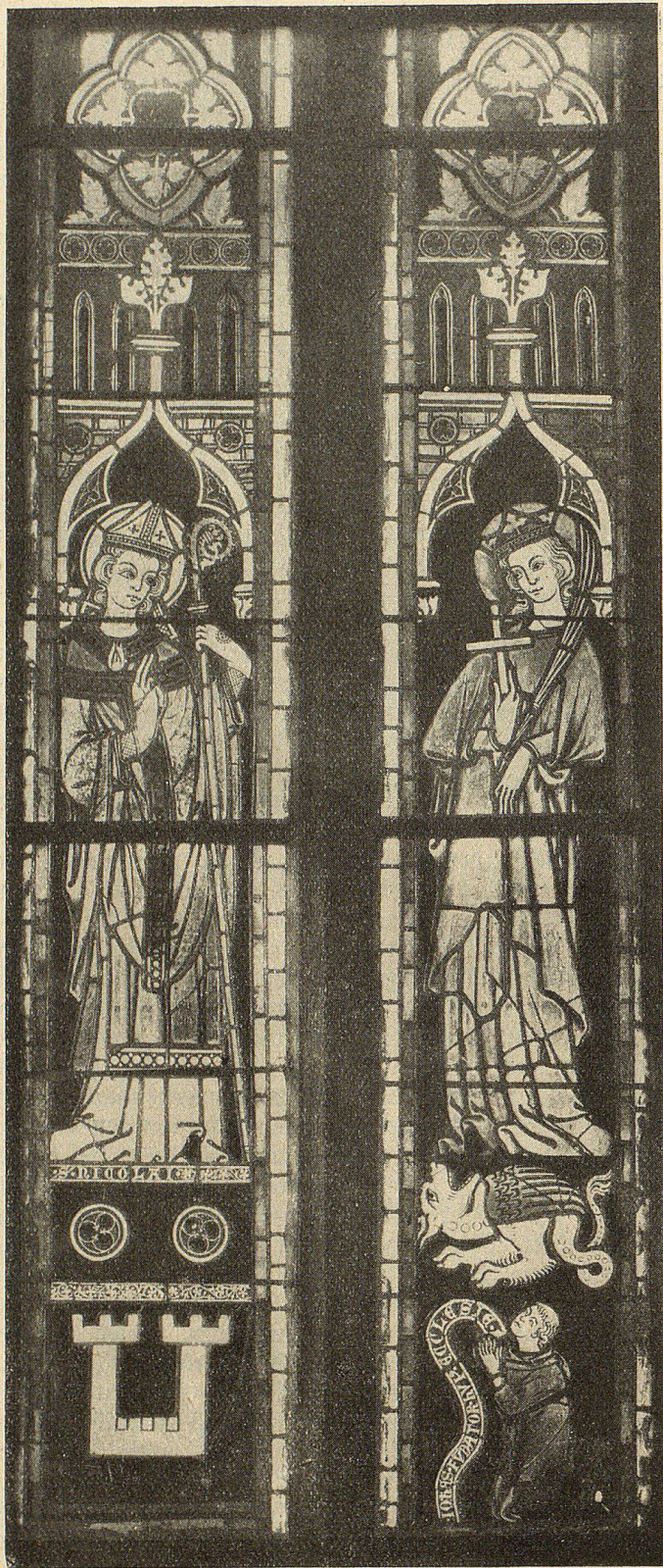
Abb. 1. Fenster in der Kirche zu Blumenstein (Kt. Bern) mit den Heiligen Niklaus und Margaretha, dem Stifter und dessen Wappen. Um 1300.

den Kirchen durch Anbringung ihrer Wappen in einem der Fenster oder durch die Stiftung ganzer Bildfenster mit der Einverleibung solcher hätte aber noch bei weitem nicht genügt, um zu einer schweizerischen Sitte der Fenster- und Wappenschenkung zu werden, da derartige Stiftungen auch außerhalb der Grenzen unseres Landes in ähnlicher Weise üblich waren. Die Landessitte wuchs vielmehr aus anderen Wurzeln heraus.