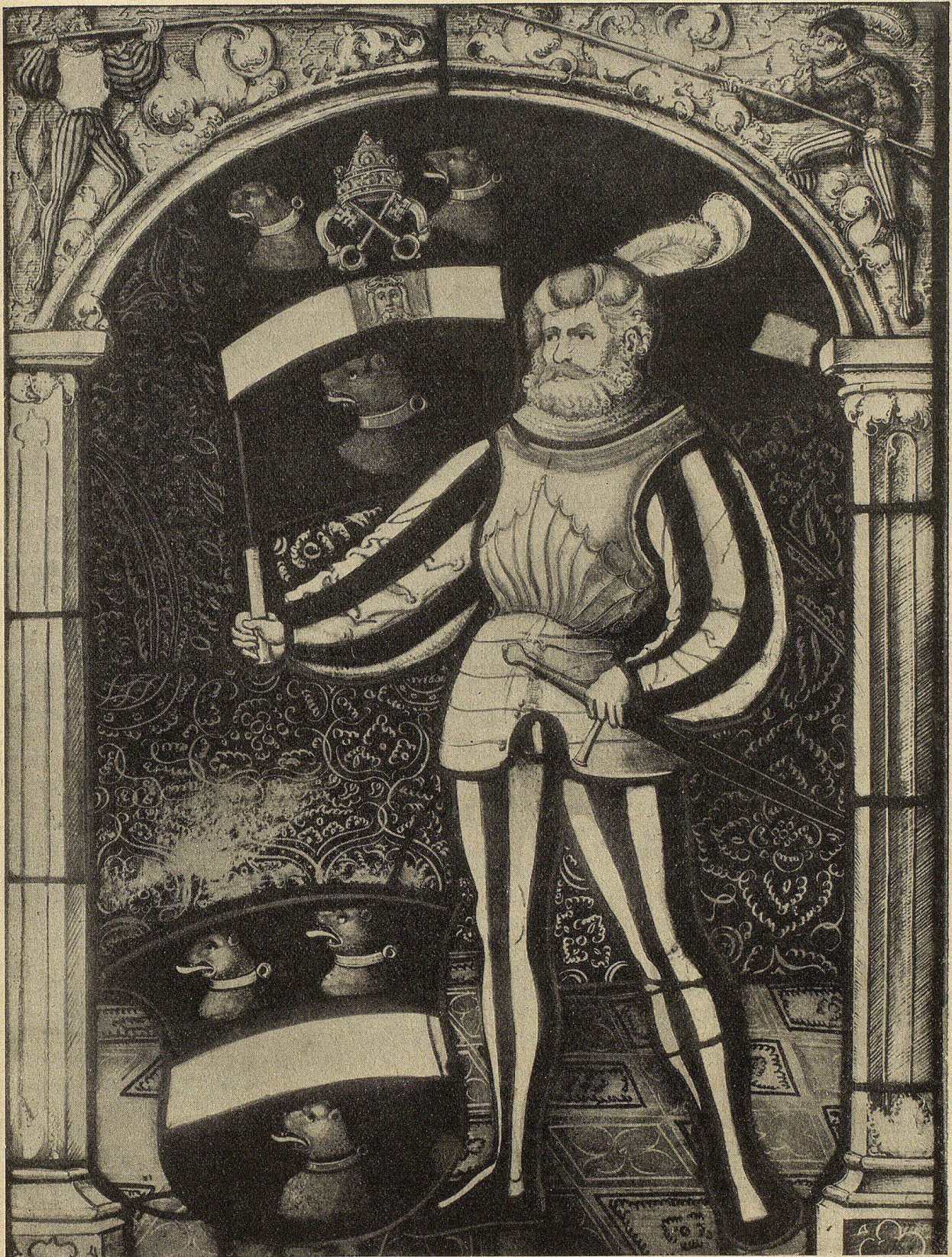
Abb. 4. Bannerträger mit dem Wappen des früheren Städtchens Elgg. Gemalt um 1515 von Lukas Zeiner in Zürich.