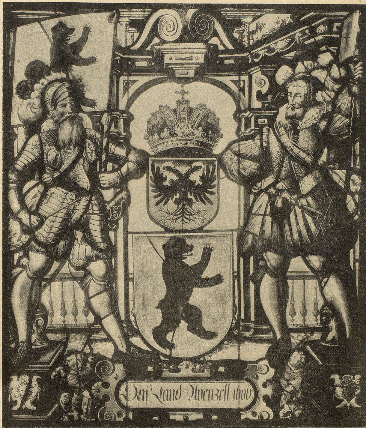
Abb. 7. Standescheibe des Landes Appenzell. Gemalt für das Rathaus in Luzern von Josyas Wurer in Zürich 1608.

verschaffen, sondern dessen Anschaffung durch Geldbeiträge erleichterte, so unterstützte man sie und die Untertanen auf dem Lande nunmehr auch in der Beschaffung von Fenstern mit Buzenscheiben zur Hebung des Wohnungswesens im allgemeinen. Das