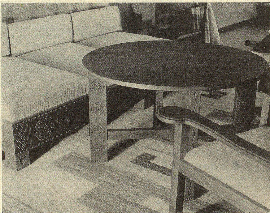
Möbel mit Kerbschnittverzierung aus dem Loggenburg. — Handgewobene Boden-teppiche und Bezüge vom Schweiz. Heimatwerk.

loren. Diese Leute sind zum größten Teil nur deshalb ausgewandert, weil für sie in ihren Heimatdörfern kein menschenwürdiges Auskommen zu finden war. In den letzten zehn Jahren hat sich die Lage weiterhin verschlimmert. Die zurückgebliebene Bevölkerung lebt trotz dem größeren Existenzraum, der durch die Abwanderung entstanden ist, manchenorts in ärmlichen, ja geradezu proletarischen Verhältnissen. Überall wächst die Verschuldung. Die Ernährung ist oft unzureichend, der Gesundheitszustand in manchen Dörfern erregt Besorgnis. Auch Kleidung und Hausrat müssen als armselig bezeichnet werden. An vielen Orten fehlt es fast vollständig an Verdienstmöglichkeiten. Die in früherer Zeit übliche Selbstanfertigung von Wäsche, Kleidung und Hausrat hat stark abgenommen, seit die neuzeitlichen Verkehrsmittel es der Bergbevölkerung gestatten, zu einem Hauptabnehmer minderwertiger Massenware zu werden. Dadurch wurde der Abstieg in proletarische Verhältnisse noch besonders beschleunigt. Es wäre auch noch zu erwähnen, daß die aus dem Heimatprinzip der Versorgung erwachsenden Armenlasten vielfach den größten Teil der jährlichen Steuereingänge der Berggemeinden verschlingen. Man wird vielleicht fragen, wie es denn mit den wirtschaftlichen Vorteilen der Fremdenindustrie stehe. Diese bleiben unbestritten; doch kommen sie leider nur einem beschränkten Teil der bergbäuerlichen Bevölkerung zugute. So muß man feststellen, daß Konkurrenz und