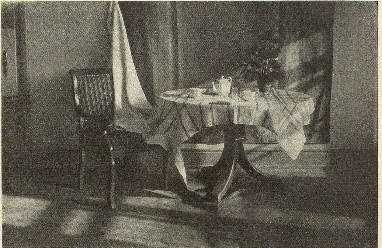
Leinene Tischtücher, farbige Tischdecke und Möbelbezug von der Appenz. Vereinigung für Handweberei Speicher.