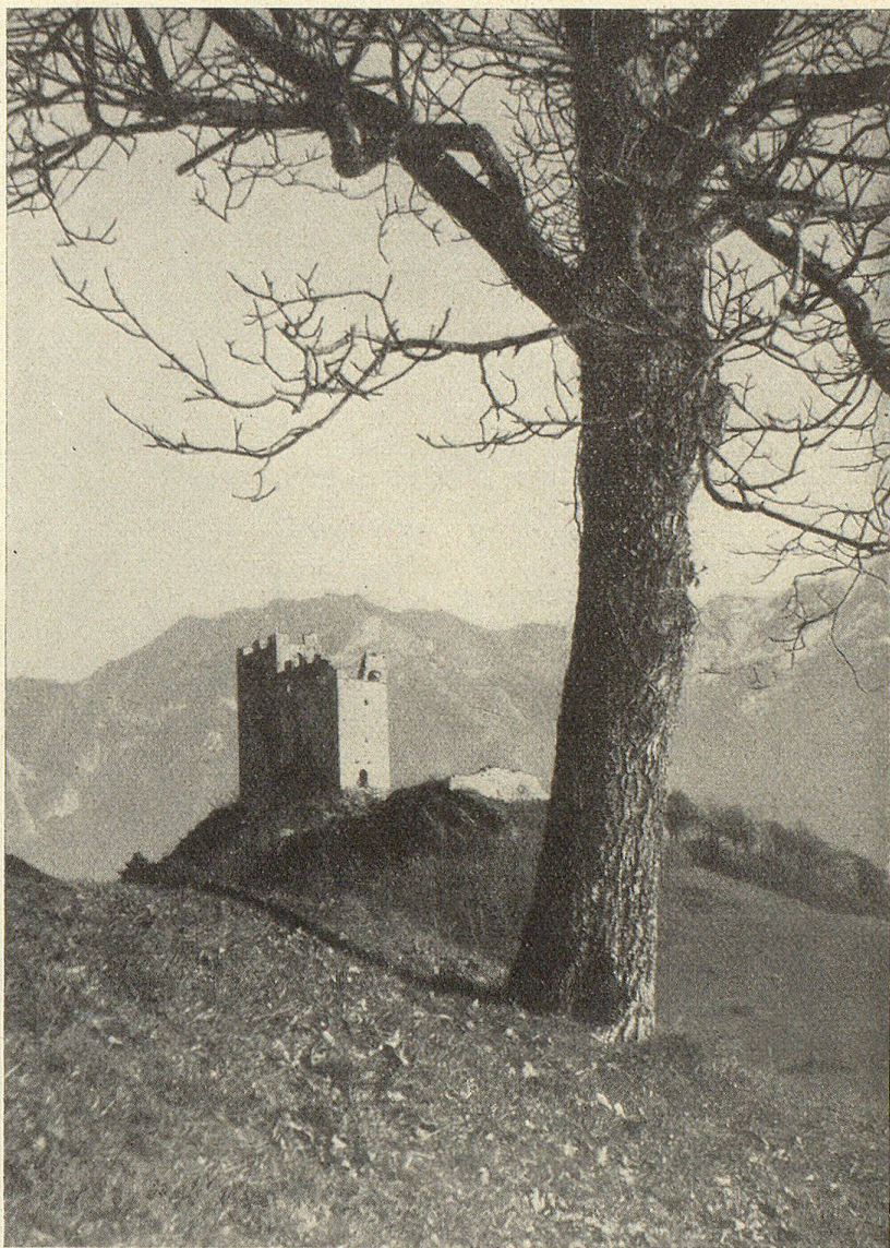
Burgruine Wartau nach der Restauration.

Als der Appenzellerkrieg ausbrach, saßen sie auf Blatten, nicht mehr auf der Ramswag, die durch Heirat einer Ramswagerin mit Rudolf von Rosen-