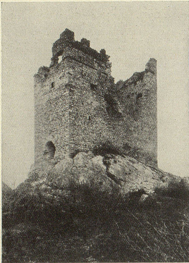
Burgruine Wartau im früheren Zustand.

Burgenverein tätig: Er berät diejenigen, welche an die Sicherung einer Ruine gehen wollen, übernimmt auf Wunsch die Aufsicht über den Gang der Erhaltungsarbeiten, unterstützt durch Geldbeiträge, und hat auf diese Weise in der kurzen Zeit seines Bestandes schon mehr als ein Duzend Ruinen retten geholfen, nicht zum mindesten schon dadurch, daß er durch seine Propagandatätigkeit die Geister weckt und Geldquellen erschließen hilft. So hat Herr a. Ständerat und Regierungsrat Näf in Genf aus Anhänglichkeit an seine Vaterstadt St. Gallen dem Historischen Verein des Kantons St. Gallen zur Erhaltung der Burgen und Ruinen der Kantone St. Gallen und Appenzell die ansehnliche Summe von Fr. 25 000.— zur Verfügung gestellt, deren Zinsen jeweils den soliden Grund der in die Wege zu leitenden Rettungsaktion darstellen, und es ist gelungen, drei Ruinen, deren Einsturz unmittelbar bevorstand, dem Landschaftsbild zu erhalten: Freudenberg bei Ragaz, Alt Rams wag bei Haggenschwil und neuestens: