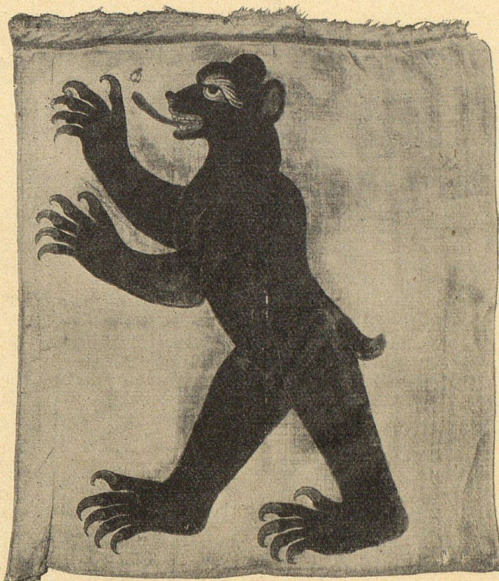
Banner von Appenzell, bemalte Leinwand, 1. Hälfte 15. Jahrh.

Das Fahrzeitbuch der St. Laurenzenkirche zu St. Gallen erwähnt die gefallenen St. Galler beim