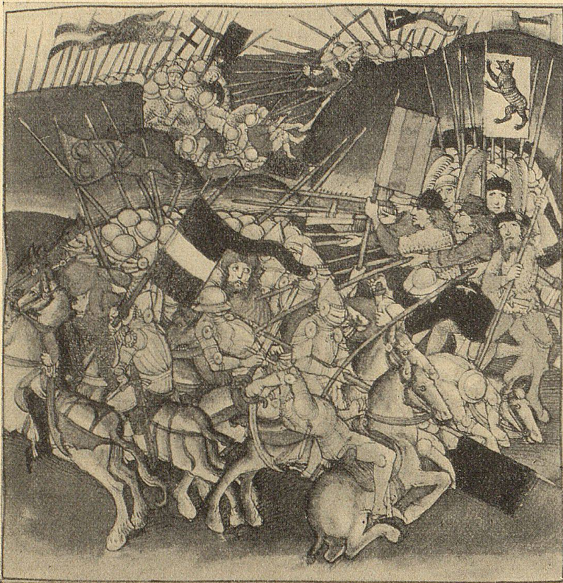
Das Treffen am Stoß, 1405 (Miniatur Diebold Schillings private Bernerchronik 1480—1484).

Als mit der Wahl des Fürstabtes Kuno von Stoffeln 1379 die äbtische Politik eine andere Wendung nahm, änderten sich die Verhältnisse. Dieser ritterliche und sehr weltlich gesinnte Herr suchte auf jede Weise seine Macht zu vergrößern und durch eine straffe Regierung und rücksichtslose Eintreibung der Steuern besonders die Appenzeller wieder in das alte Untertanenverhältnis der vorrudolfinischen Zeit zurückzuzwingen. In seine Burgen setzte er zu diesen Zwecken Vögte. Dies ließen sich die freiheitsliebenden Landleute nicht gefallen. Sie schlossen 1401 mit den unzufriedenen St. Gallern und den anderen hauptsächlichsten Ortschaften des äbtischen Gebietes einen Abwehrbund. Wir erinnern daran, daß durch den Sieg der Eidgenossen bei Sempach 1386 und der Glarner bei Näfels 1388 allenthalben der Widerstand des Landvolkes gegen die Fendalherrschaft gekräftigt wurde. Die Appenzeller erhielten nun besondere Unterstützung durch Schwyz, dessen überschüssige Expansionskraft sich nach dem Thurgau, überhaupt nach der Ostschweiz einen Ausgang suchte. Die Appenzeller traten 1403 mit Schwyz in ein Landrecht ein, das im Kriegsfall militärische Unterstützung bedingte. Da der Abt nicht nachgab, brach der offene Kampf aus. Wie etwas mehr als 100 Jahre früher die Inner- und Ob- und Nid-Schweizer, brachen nun die Appenzeller die äbtischen Burgen und verjagten die Vögte. Der