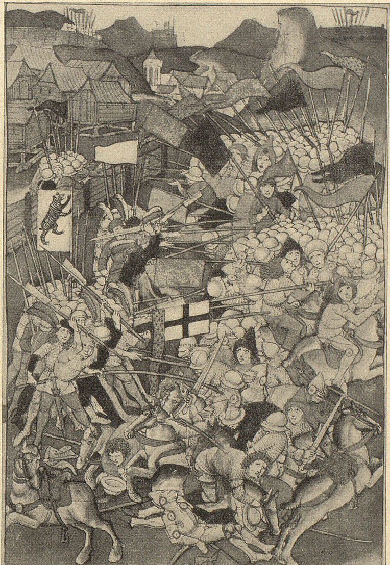
Das Treffen am Speicher, 1403 (Miniatur Diebold Schillings private Bernerchronik 1480—1484).