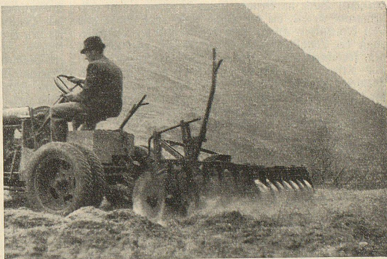
Wo einst Dedland sich breit machte, wird bald Korn sich wiegen Die Säemaschine an der Arbeit.

Die Landflucht, die später wieder in irgend einer Form zur Stadtfucht führt, wird kaum je zu beheben sein in einem freien Staate; so wurden aus diesen Flüchtlingen nicht selten hervorragende Persönlichkeiten, wie andere in der Fremde auch vorkommen. Seit Eisenbahnen und Straßen Stadt und Land verbinden, hat das Geseß der Sehnsucht nach dem, was man nicht besitzt, krankhaft von den Menschen Besitz ergriffen: der Mensch sieht auf den ersten Blick eben nur das, was ihm entgeht und es lockt ihn das andere, das er nicht kennt. So nur ist es zu verstehen, daß überall, nicht nur in der Schweiz, eine Flucht einsetzte in die