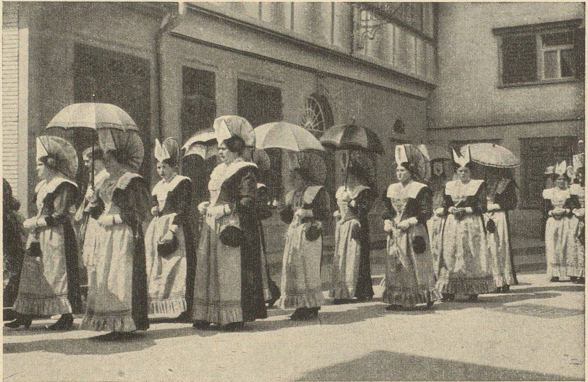
Appenzellerinnen in der Festtracht

wie der neue Glaube hat einen spürbaren Einfluß auf das Andersgeartetein der zweierlei Appenzeller ausgeübt. Vielleicht ist aber die Wurzel der Verschiedenheit tiefer und älter. In Innerrhoden setzte sich das Röto-romanische stärker durch und vermochte sich zäher zu erhalten. Man hat die Eigenart der beiden Appenzeller auf einen gemeinsamen Nenner zu bringen versucht: