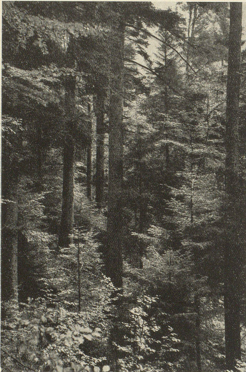
Gemischter, durch natürliche Verjüngung entstandener Wirtschaftswald

entsprechen. Während Jahrtausenden, hat hier unter vielen Beteiligten ein Wettbewerb stattgefunden, in welchem schließlich der unter den gegebenen Bedingungen Leistungsfähigste und Lebenstüchtigste Sieger blieb. Heute weiß der Forstmann, daß es eine Anmaßung wäre, wollte er das Ergebnis dieser von der Natur selbst vorgenommenen Artenauslese nach eigenem Ermessen verändern. In einem Wald, der durch seine bisherige Bewirtschaftung in seiner ursprünglichen Zusammensetzung gestört wurde, richtet der forstliche Praktiker seine ganze Aufmerksamkeit darauf, für jeden Waldort diejenigen Baumarten zu ermitteln, die hier ohne Zutun des Menschen stehen müßten. Er weiß, es gibt kein besseres Mittel, um hier dauernd einen