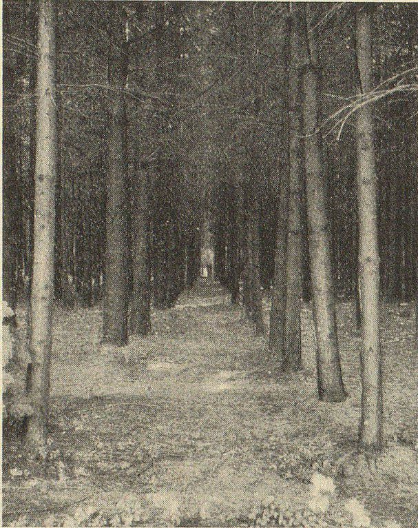
Einfrörmiger, gleichaltriger durch Pflanzung auf Kahlfäche begründeter Wirtschaftswald. Beispiel eines naturwidrigen, daher kranken und auf die Dauer lebensunfähigen Kunstproduktes.