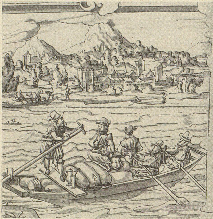
Berner Schiffsleute des 17. Jahrhunderts (Scheibenriß, im Historischen Museum Bern)

Pferden gezogen werden, „getreckt“ werden. Die Schiffsahrt auf dem Obersee besorgten die Schiffsleute von Schmerikon, die im 18. Jahrhundert zur Herbstzeit ihre Schiffertänze auf den Brettern, die sie über ihre Schiffe legten, getanzt haben.