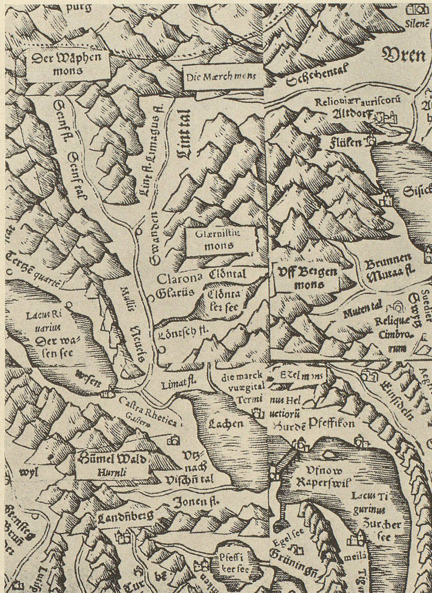
Ausschnitt aus der Landkarte der Schweiz von Aegidius Tschudi, vom Jahre 1538.

Mehrzahl einer entrundeten Nebenform zu Frutt – zum gleichen Komplex gezählt werden. Der Typus drang dann via Durnachtal über die Wasserscheide bis ins Seensttal vor, wo die jetzige Wichlenmatt 1569 noch, gleichsam phonetisch geschrieben, als „Grupmatt“ (d. h. Fruttmatt) bezeichnet wurde. Vielleicht ist auch Durnach, Durnach, gallischer Herkunft, wenn man den Namen zu den verschiedenen Turnacum (Tournai usw.) im alten Gallien stellen darf. Als gallische Bedeutung kommt „Anhöhe, Hügel“ in Betracht, was zum hochgelegenen Eingang ins Durnachtal beim Nestiberg nicht übel passen würde. – Der Panixerpaß hieß im Mittelalter Wepch, Wepchen usw., in der älteren Glarner-