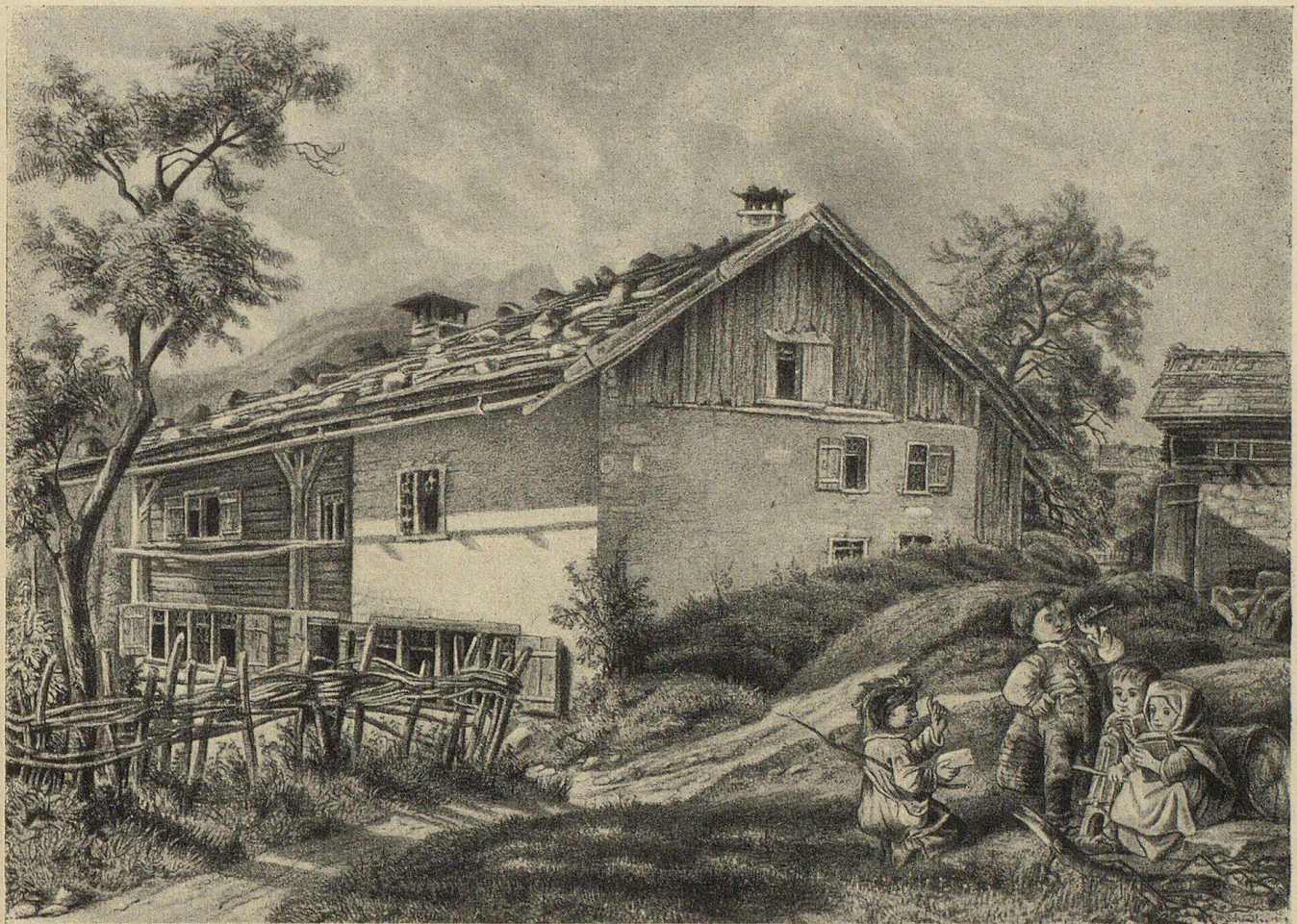
Geburtshaus Glareans in Mollis Lithographie nach Zeichnung Wilhelm Schindlers, 1860