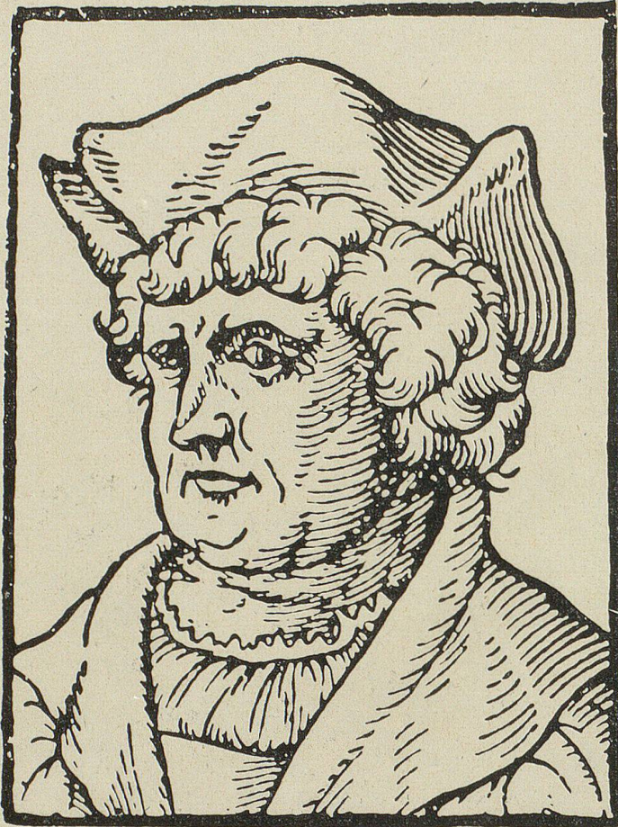
Heinrich Loriti genannt Glarean

der zum bedeutendsten Humanisten der Schweiz heranwuchs, nämlich Heinrich Loriti von Mollis (1488–1563). Er nannte sich nach seinem Heimattal, oder, wie er später erklärte, nach seiner elterlichen Heimstätte, dem Steinacker, wo sein Geburtshaus noch steht, Glareanus. Er war sowohl eine eigenwillige als auch ausgeprägte urwüchsige Persönlichkeit von umfassendem Wissen, der während eines halben Jahrhunderts als Lehrer eine unermüdlige erfolgreiche Tätigkeit entfaltete. Daneben zeichnete er sich als Dichter von Rang, als Philolog, als Geograph und Kartograph, als Mathematiker und Musiker aus. Die Frucht seiner schriftstellerischen Lebensarbeit besteht aus 30 zu seinen Lebzeiten gedruckten Werken; andere sind erst in unserer Zeit ans Tageslicht gefördert worden, weitere harren noch der Bearbeitung und Veröffentlichung.