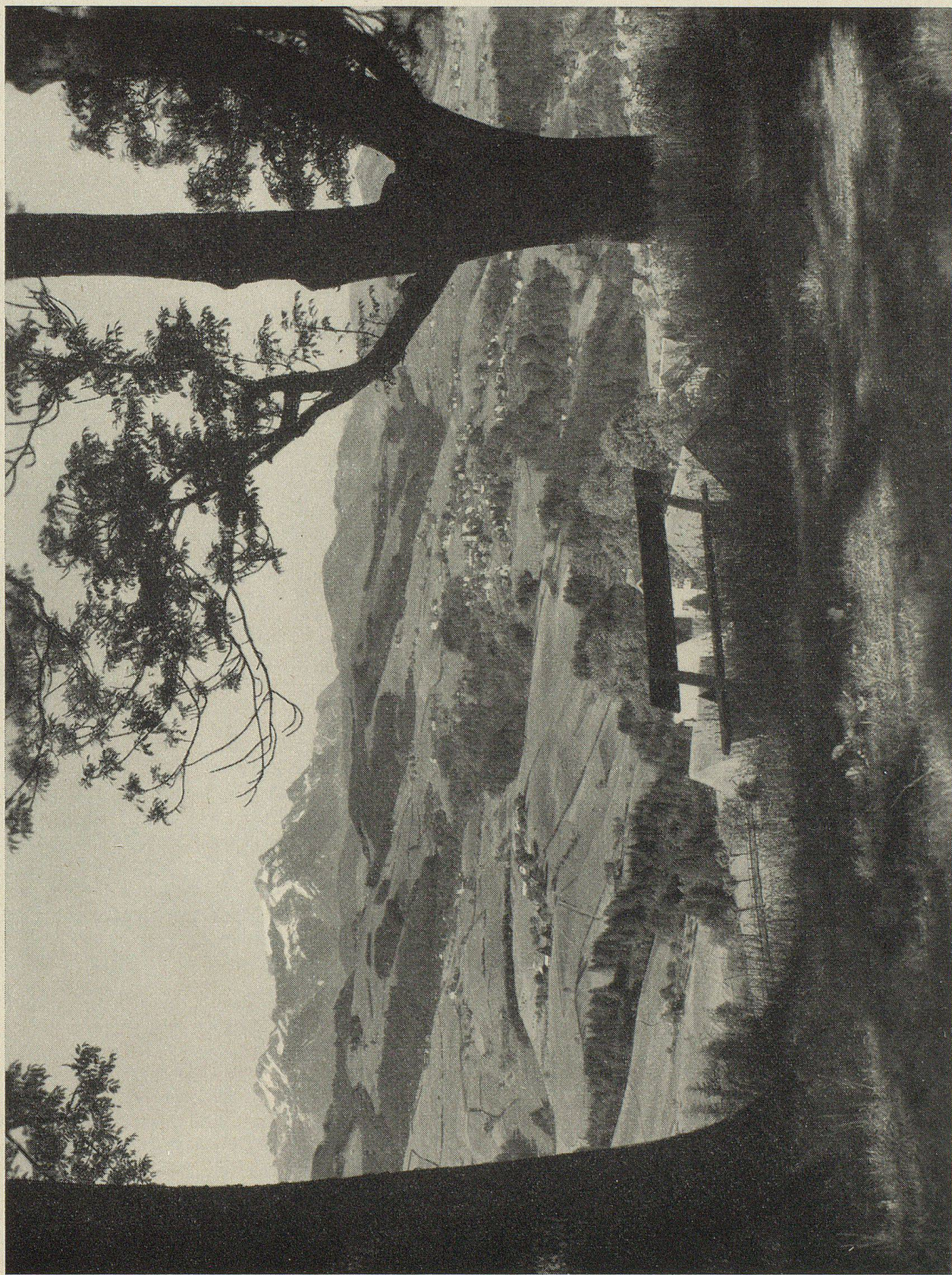
Blick vom Gupf gegen Trogen, mit Altmann und Sântis im Hintergrund