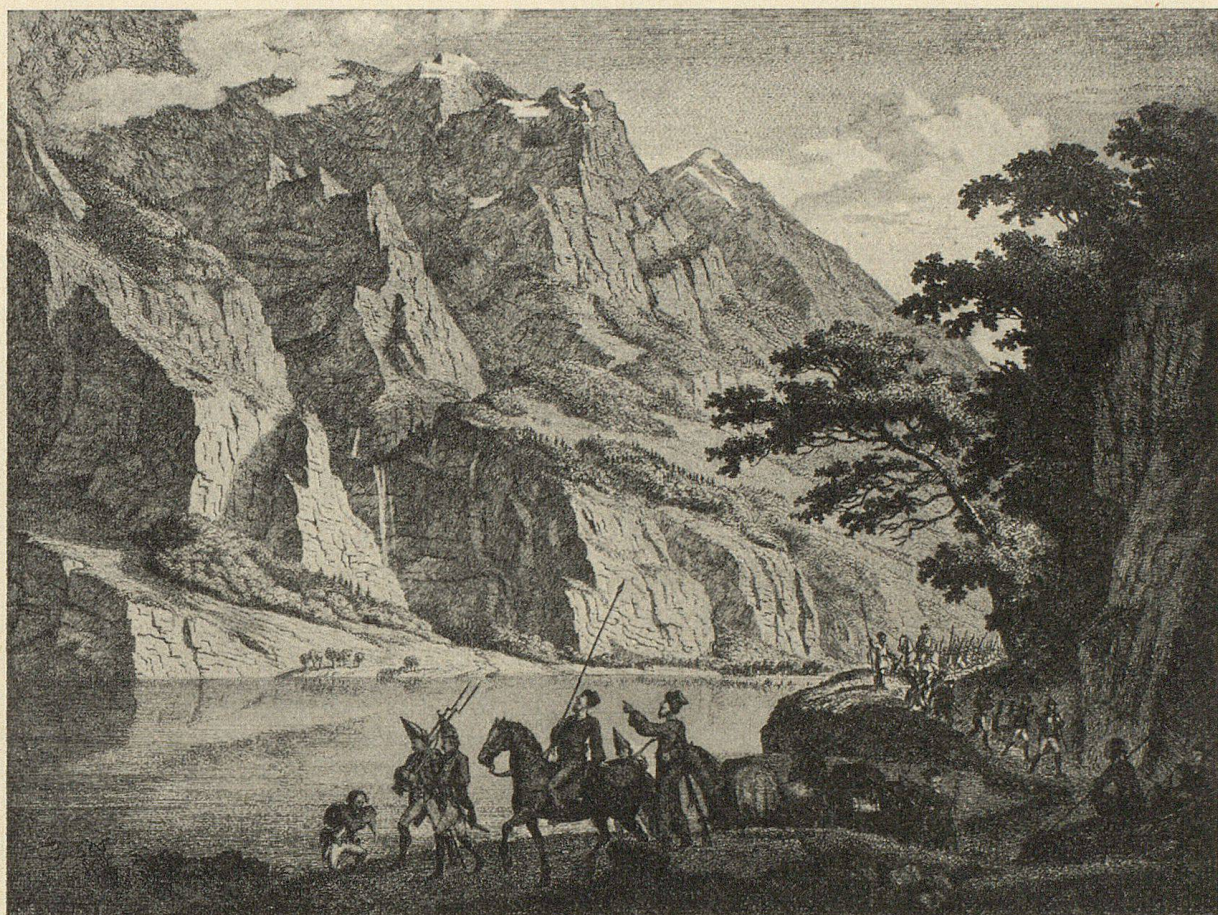
Die russische Armee des Generals Suworow im Klöntal, Oktober 1799