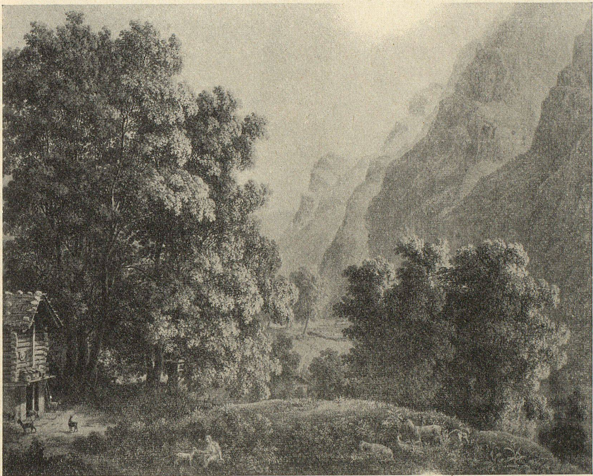
Klöntal-Richisau. Sepia von Helmsdorf, 1811