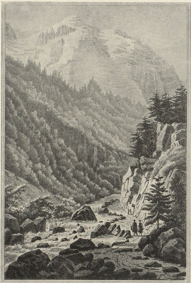
Lithographie von Villeneuve. 1826