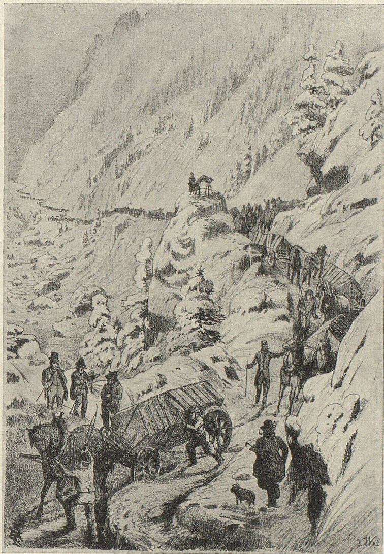
Lithographie von Ed. Pingret. 1826