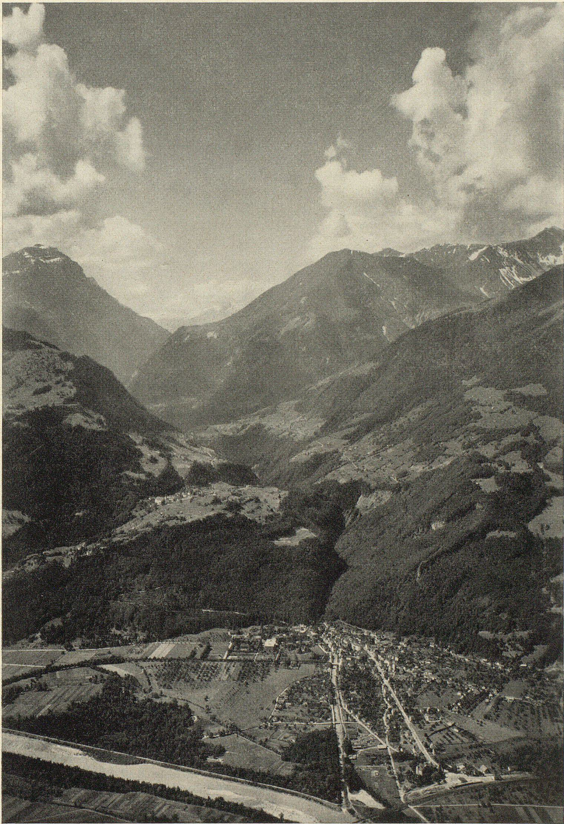
Bad Ragaz mit Blick gegen Pfäfers und die Taminaschlucht

(Klischee aus «Am jungen Rhein» von A. Jetter und E. Nef, Verlag Paul Haupt, Bern)