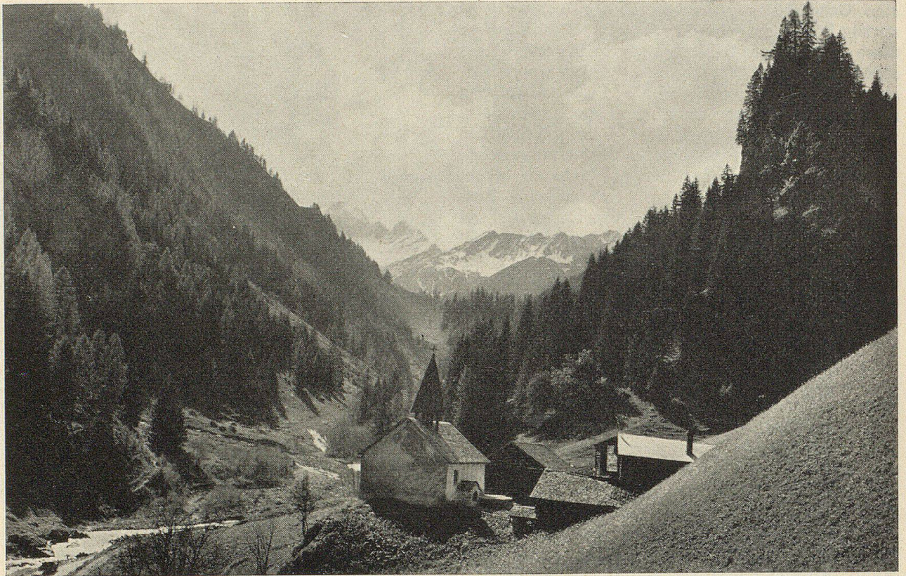
Das Kirchlein von St. Martin im Calfeisental

Einstige Talkirche der freien Walser. Blick talaufwärts: Im Hintergrund Piz Sardona, wo die Tamina entspringt