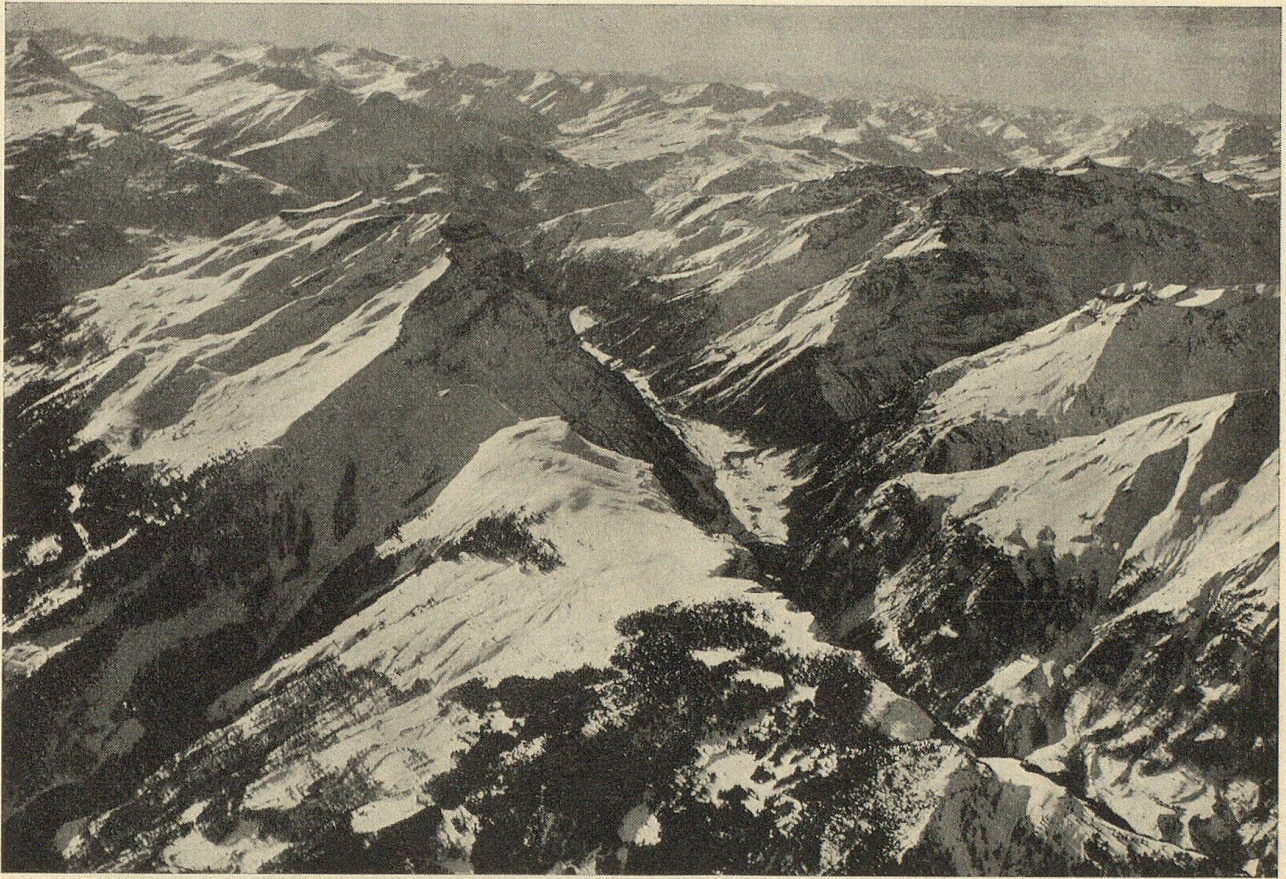
Das Taminatal vom Flugzeug aus gesehen

In der linken Bildhälfte das Massiv des doppelgipfligen Calanda, in der Bildmitte die Talmulde von Vättis, rechts davon Eingang ins Calfeisental, darüber die Ringelspitze, rechts außen der Drachenberg.