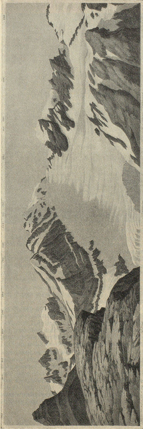
Kistenpaß, Panorama von J. F. Lips, 1879

Blick vom Kistenpaß gegen Limmerngletscher, im Vordergrund links die kahle Felsterrasse des Passes, dahinter das Kistenstöckli und die Brigelker-Hörner, Mitte der Glarner Tödi, rechts der Hintere Selbsanft.