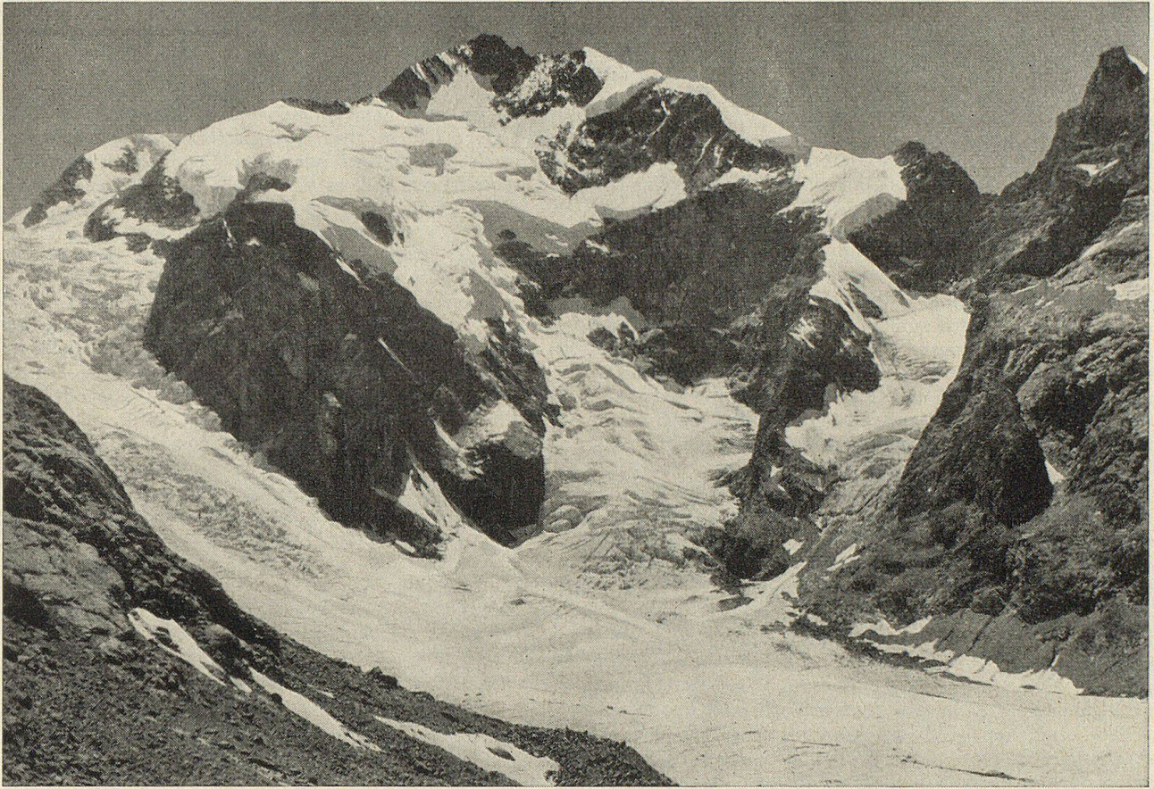
Piz Bernina 4055 m. ü. M.

Im Vordergrund der Morteratschgletscher. Vom Gipfel des Berges senkt sich eine Firnwand hinab auf den Schwarzen Saß del Pos, neben dem sich der von der Crast agüzza niederfließende Morteratschgletscher zum sog. «Labyrinth» staut.