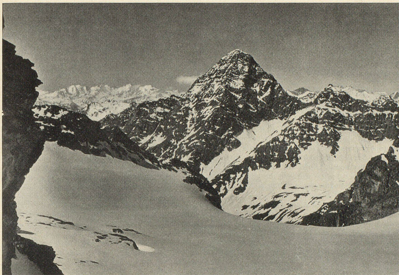
Piz Linard (3414 m ü. M.) im Unterengadin