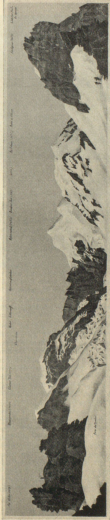
Porta da Spescha, Panorama von J. F. Lips, 1864

Blick vom Kistenpaß gegen Limmerngletscher, im Vordergrund links die kahle Felsterrasse des Passes, dahinter das Kistenstöckli und die Brigelker-Hörner, Mitte der Glarner Tödi, rechts der Hintere Selbsanft.