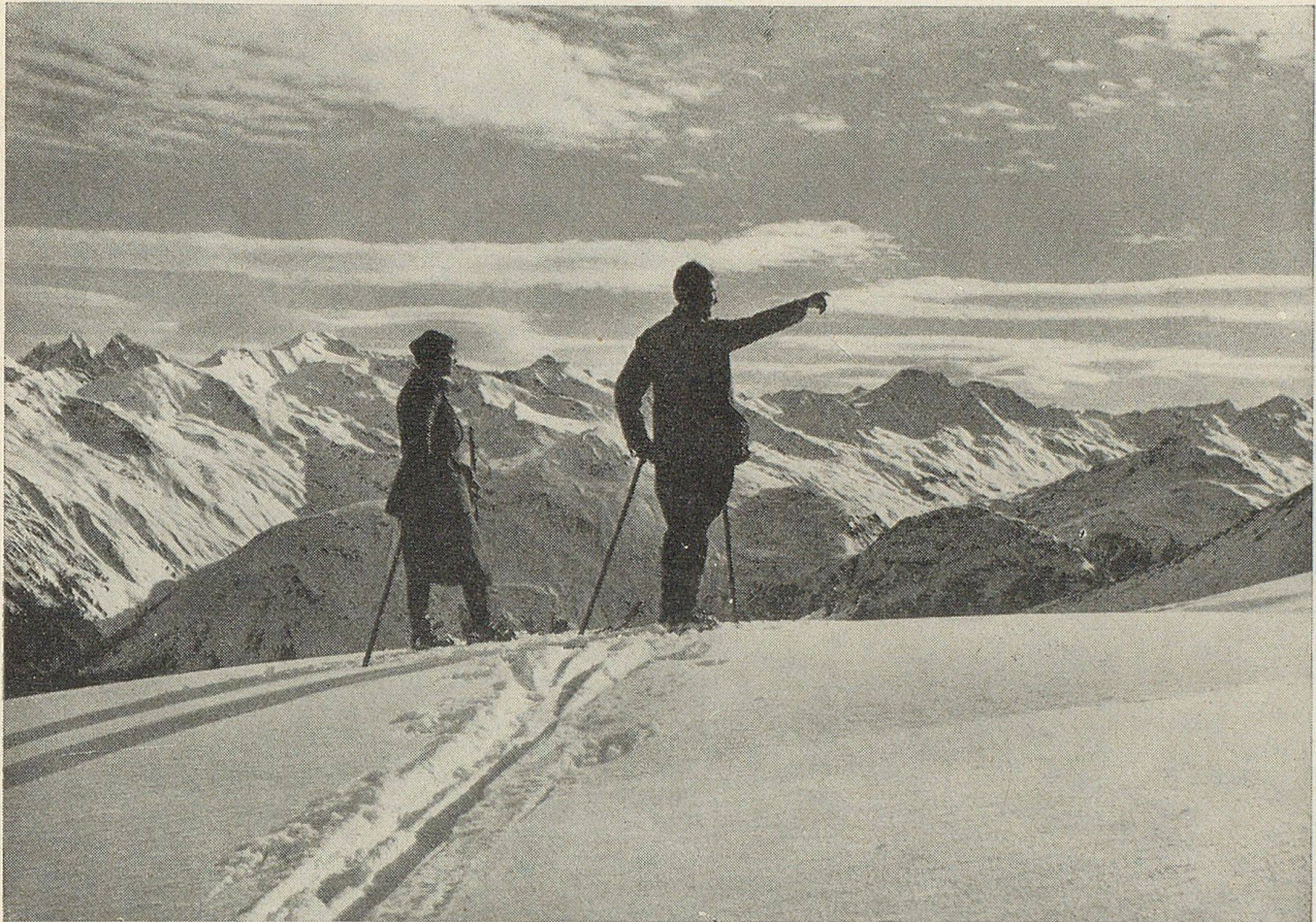
Wunder des Winters, die erst der Skisport offenbart hat In den Bergen ob Klosters. Aufnahme aus den 20er Jahren