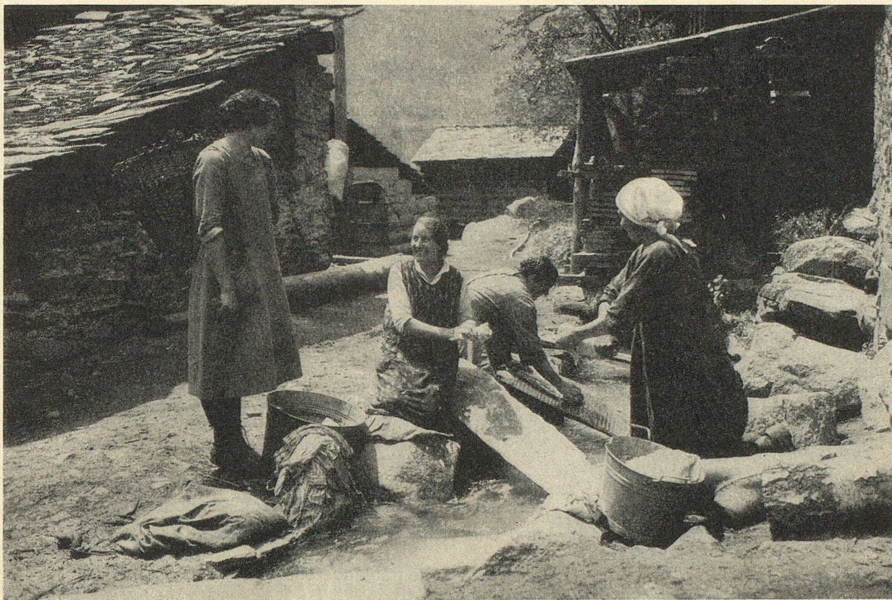
Dorfidyll im Walliser Bergdorf Außerberg. Washtag am Gletscherbach.