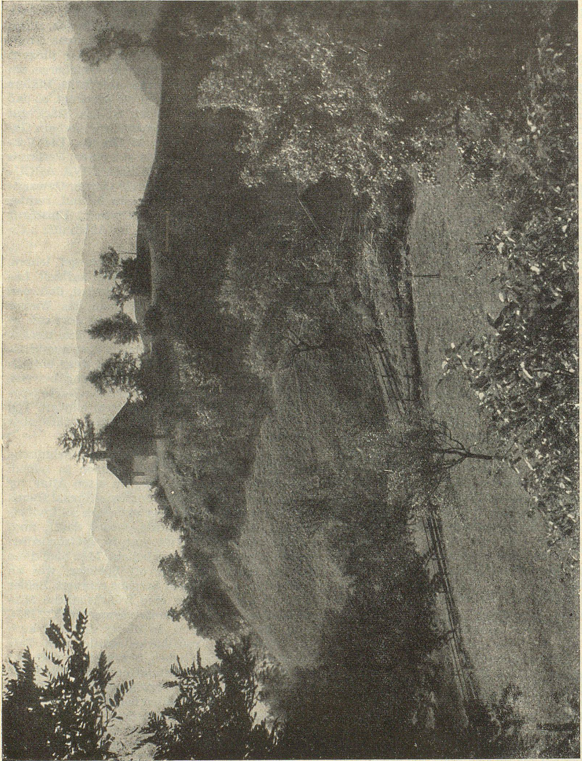
Blick auf den St. Georgshügel. Auf dieser Kuppe muß nach dem St. Margaretha-Lied aus dem 8. Jahrhundert schon in früher Zeit eine Kapelle gestanden haben. Der heutige Bau soll 1430 errichtet worden sein. Auf dem Kapellenhügel fanden sich Spuren ur- und frühgeschichtlicher Besiedlung sowie römische Mauerreste, die von einer damaligen Befestigung herrühren könnten.