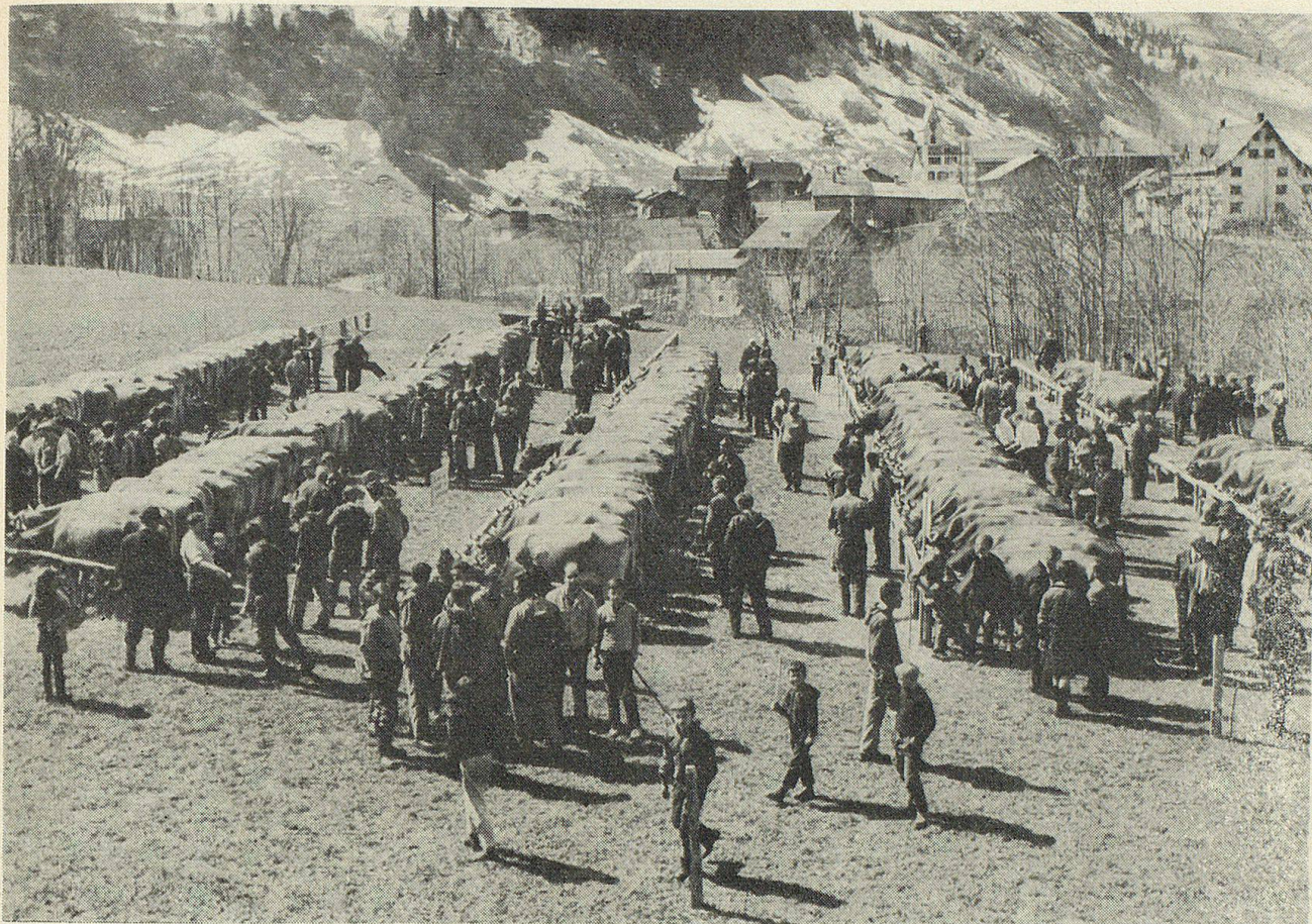
Jubiläumsviehschau in Elm GL