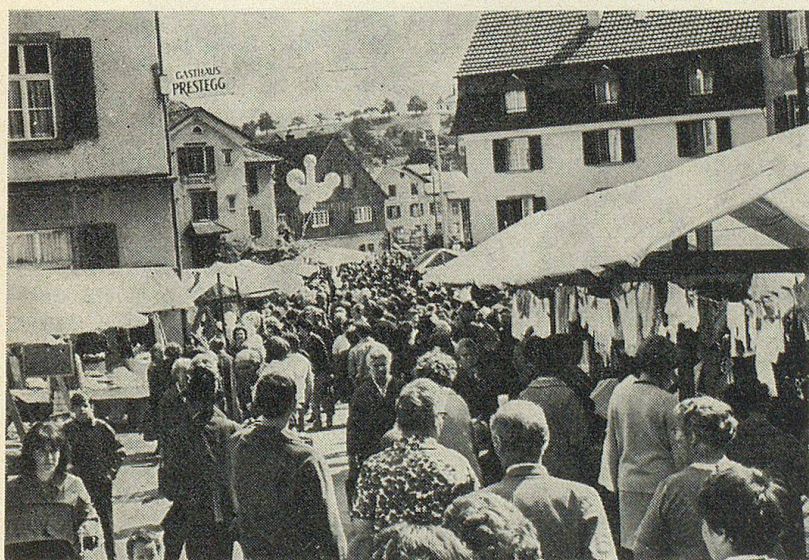
Maimarkt in Altstätten

Ein bedeutender Marktflecken auch für das benachbarte Appenzellerland war seit jeher Altstätten im St. Galler Rheintal.