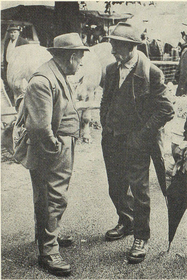
Stelldichein auf dem Viehmarkt

Die Epoche des Mittelalters war meist unsicher. Fehden des Hochadels, Brandschatzungen und Raubzüge von Söldnern plagten das Land. Da war es Aufgabe und Pflicht des Burgadels und der Ritter, den Kaufmannszügen und ihren Saumtierkolonnen sicheres Geleit und Schutz zu bieten.