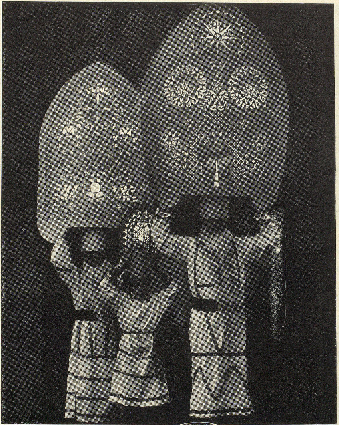
Seit Jahrhunderten gilt St. Niklaus nicht nur als Schutzpatron der Seefahrer und Kaufleute, sondern vor allem auch als der große Freund der Kinder. Zu den originellsten Niklausbräuchen, die sich in der Schweiz erhalten haben, gehört das Chlausjagen in Küssnacht am Rigi. Auf dem Kopf tragen die über hundert Chläuse am Abend des 6. Dezember leuchtende Infuln. Die aus Karton und buntem Papier gestalteten Bischofshüte erinnern an gotische Kirchenfenster.