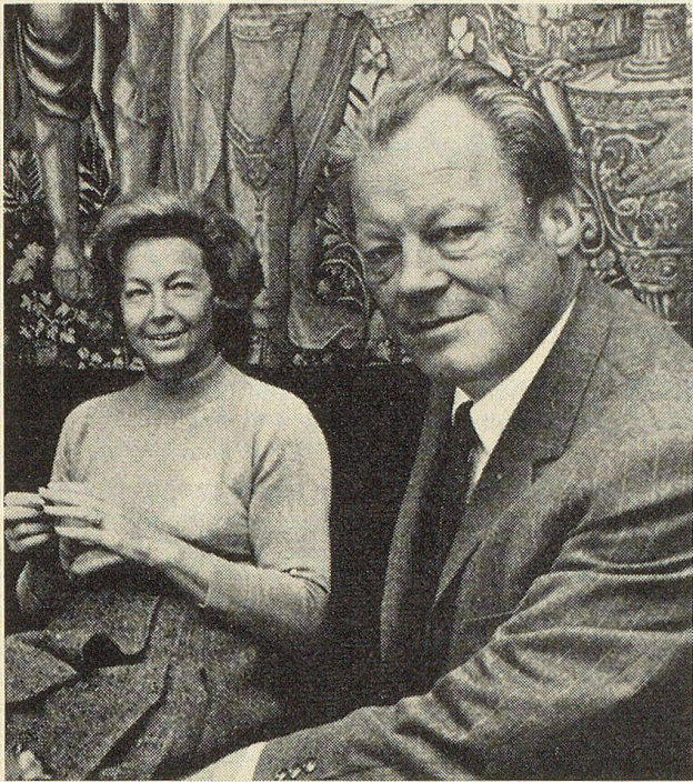
Der zurückgetretene Bundeskanzler Willy Brandt (BR Deutschland) mit seiner Gattin Rut