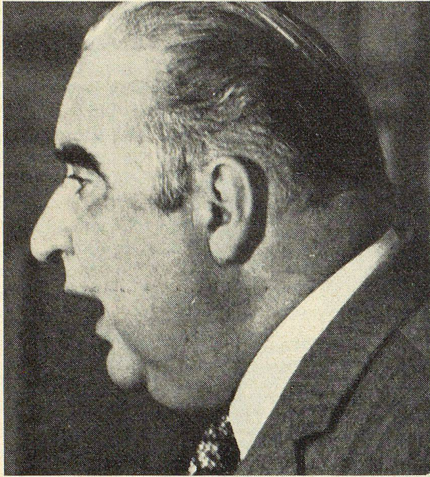
Der verstorbene französische Ministerpräsident Georges Pompidou

Volk bestätigen zu lassen. Seine Partei erlitt aber eine schwere Niederlage, und Labour-Führer Harold Wilson bildete eine zerbrechliche Minderheitsregierung. — Unstabil blieb die Lage auch in Italien, wo die Christdemokraten mit der Bestätigung der zivilen Ehescheidung durch das Volk eine Schlappe einstecken mussten. — Selbst in der Bundesrepublik Deutschland kam es zu einer unerwarteten Krise, als eine düstere Spionageaffäre zugunsten der DDR platzte. Bundeskanzler Willy Brandt sah sich veranlasst, zurückzutreten. Nachfolger wurde am 16. Mai 1974 sein SPD-Kollege Helmut Schmidt. Außenminister Walter Scheel rückte in das Amt des Bundespräsidenten auf, nachdem Gustav Heinemann auf eine weitere Amtsperiode verzichtet hatte. — Eine unerwartete Wendung trat auch in Frankreich ein: Am 2. April 1974 starb Präsident Georges Pompidou im Alter von 62 Jahren. Als zweiter Präsident der V. Republik hatte er 1969 de Gaulles Nachfolge angetreten. Nach einem spannen-