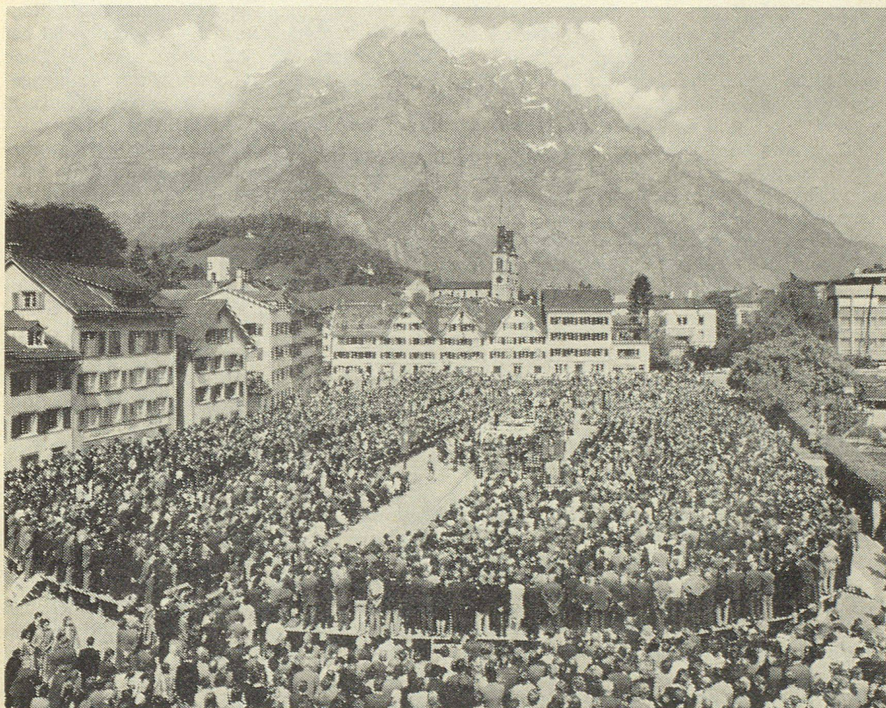
d Glarner Landsgmei