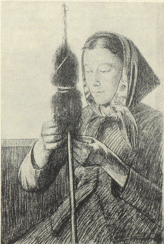
Spinnerin aus dem Oberwallis Studie von Jean Morax

Viele Sprichwörter und Redensarten, die heute noch in «aller Leute Mund» sind und zum täglichen Wortschatz des Volkes gehören, ranken sich wie ein blütenreiches Gebilde um das Spinnen und Weben, um Flachs, Lein und Wolle. So lautet z. B. ein Sprichwort: