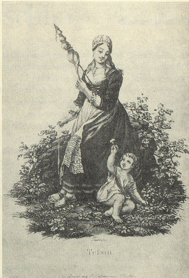
Tessiner Spinnerin aus der guten alten Zeit

«Und Bertha, die die Spindel auch geführt, Sogar zu Pferd, verschwindet in der Ferne, Erreicht bald ihr Königsschloss Payerne.»