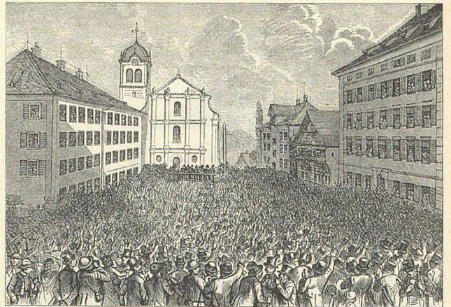
Landsgemeinde von Trogen, von E. Rittmeyer

Von der Witterung 1874/75 wird geschrieben, dass der Spätsommer und Herbst 1874 sehr warm und fruchtbar gewesen seien. Obst und Wein seien gut gediehen. Dann folgte ein strenger Winter, allerdings ohne viel Schnee. Der Frühling 1875 hatte nicht eben gutes Wetter, so dass das Vieh spät auf die Weide getrieben werden konnte und das Heu «horrende Preise» (10 bis 12 Franken je Zentner) erzielt habe. Im August 1875 kostete gutes Ochsenfleisch per Pfund 75 Rappen, das Kalbfleisch 90 und das Schweinefleisch 75 Rappen per Pfund. Im Sommer schädigte die Wanderheuschrecke die Ernte. Die Schwärme hätten auch das Appenzellerland angefliegen. Das Mass Wein erzielte Preise von 80—90 Rappen beim Roten und 50—60 Rappen beim Weissen. Im September 1875 kostete der Zentner Kartoffeln Fr. 2.50 bis 3.50, die Butter Fr. 1.40 bis 1.60 das Pfund.