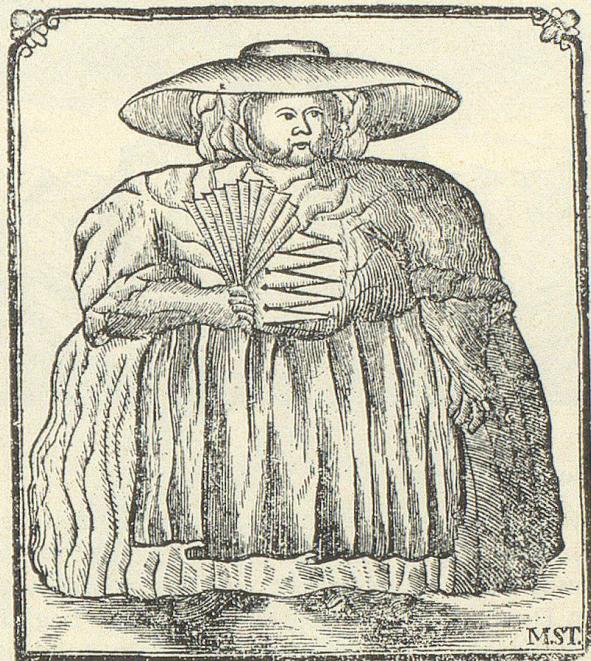
Abshilderung der dicksten Jungfer in Europa.

Diese ist zu Leeds in Engelland 1774. in ihrem 40. Jahr gestorben; (aber gewis nicht an der Abzehrung) denn sie war 2. englische Ellen lang, aber um den Leib 3. Ellen dick, und wog vier Centner. Es waren 20. starke Männer nöthig, um die Jungfer mit ihrem Sarge in das Grab zu bringen.