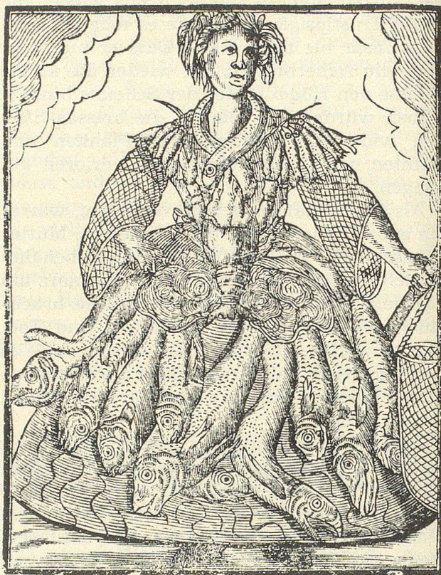
Abbildung einer Fischers-Frauen in Engelwand.

wolte, kann nicht zurück, ihr Vater oder Richter lässt sie nicht.» Der Gelehrte überzeugt dann den Bauer, dass die Irrwische nichts anderes als schweflige Dünste seien, die aus Morästen aufsteigen und fluoreszierend seien.