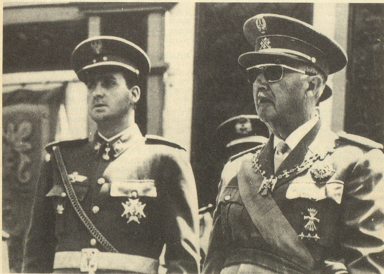
Machtwechsel in Spanien. Juan Carlos mit General Franco.