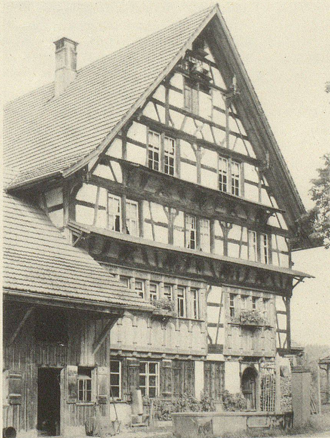
Altes Rathaus im Schwänberg

Aus weiter Ferne winkt das weithin sichtbare Schloss Zuckenriet rechts unter der schwarzen Kuppe des Gabris seinen Gruss uns zu. Vor uns zieht sich die langgezogene Steilwand des Hochschoren hin und zur Linken flankiert die Häusergruppe der Flawiler-Egg die Anhöhe jenseits des Wissenbaches. In sanften Hügeln eingebettet liegt das grosse Dorf Flawil, und über dieses hinaus schweift unser Blick das Thurtal hinunter bis gegen Wil und weiter hinab in den baumgesegneten Thurgau.