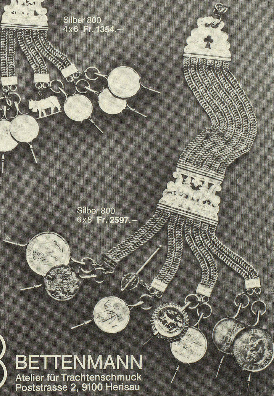
Silber 800 6x8 Fr. 2597.—