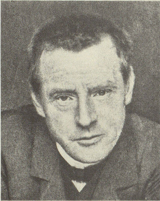
Der Schriftsteller Heinrich Federer (1866—1928).