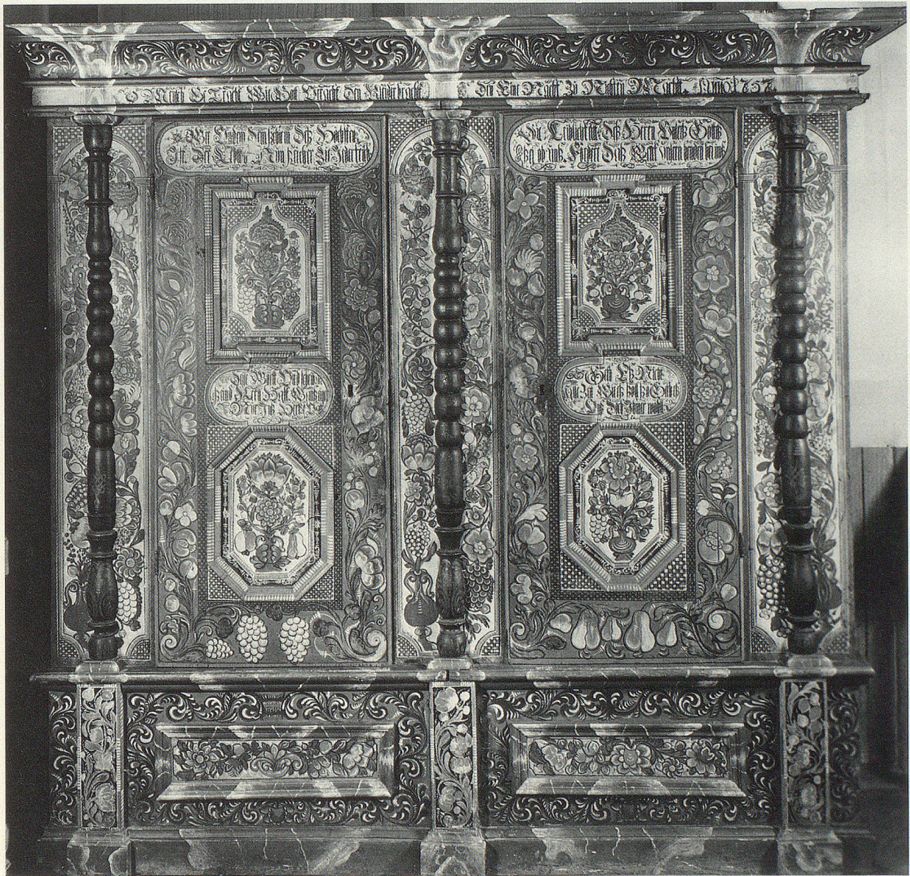
Schrank, mit zwei Türen, Barock, 1757 (möglicherweise von einem Appenzeller für einen Toggenburger Kunden erstellt).