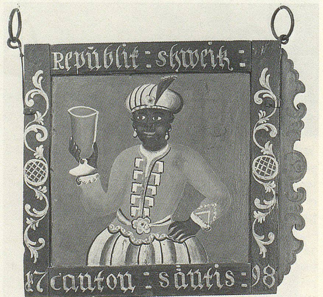
Unten: Wirtshausschild «Zum Mohren» in Wattwil: «Republik schweiz / canton säntis 1798».