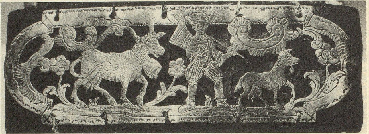
Anonym: Schlaufblech einer Senntumschelle um 1770.

fährt auf der ganzen Breite des Kastens ein Senn mit seinen Kühen. Die Malerei ist naturalistischer, kleinmeisterlicher, aber durchaus dem gleichen Typus verpflichtet.