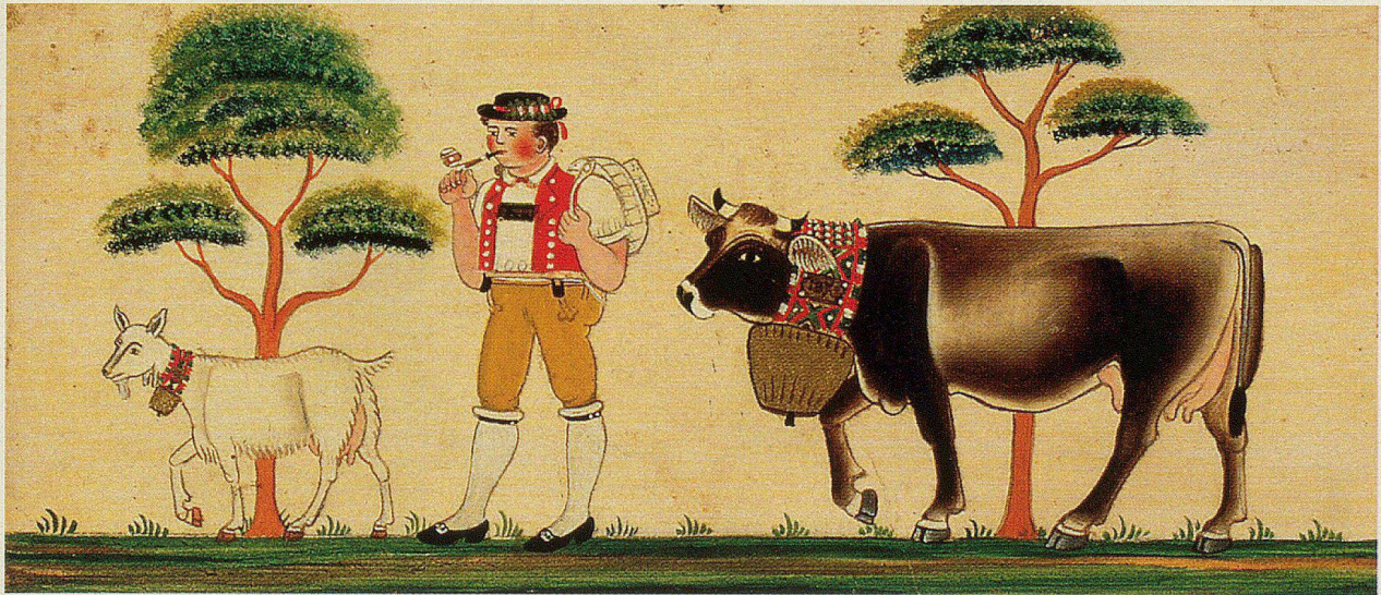
Anonym: «Geiss, Senn, Kuh», 19. Jahrhundert.