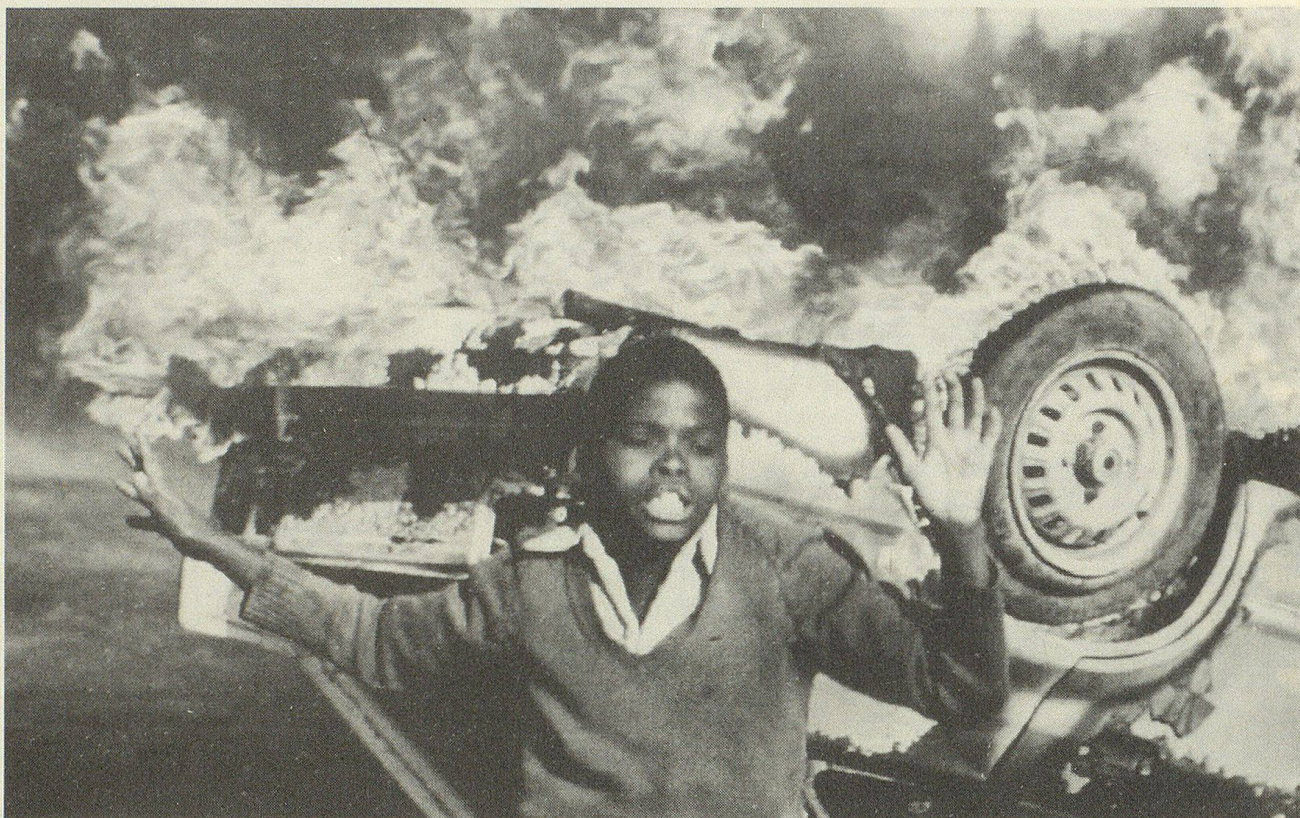
Unruhen in zahlreichen südafrikanischen Schwarzenvorstädten führten im Sommer 1985 zur Verhängung des Ausnahmezustandes in 36 Verwaltungsbezirken.

Ebenfalls kein entscheidender Durchbruch im seit 1980 währenden Krieg am Golf : Während Iran den Sieg durch wiederholte Landoffensiven zu erzwingen versuchte, setzten die Iraker ihre Luftangriffe gegen «Schiffsziele» sowie vereinzelt gegen iranische Städte fort. Friedensbemühungen zerschlugen sich allesamt an der unnachgiebigen Forderung des Khomeiny-Regimes nach «Bestrafung» des irakischen Staatsoberhauptes Saddam Hussein.