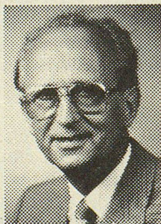
Frehner AG Herisau

Polster- und Lederpolstermöbel ★ Wohn- und Esszimmer Schlafzimmer und Studios ★ Wohnwände und Buffets Elementschränke und Betten ★ Tische, Stühle und Salontische ★ Komplette Aussteuern und Einzelmöbel!