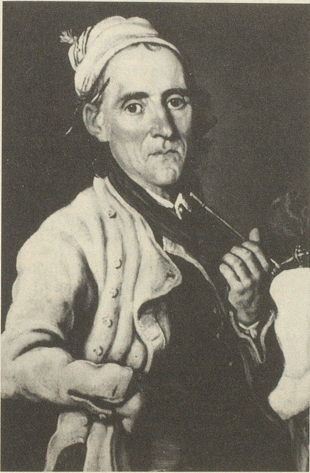
Ueli Bräker, der «arme Mann in Toggenburg» hatte am 22. November 1794 in Trogen vor Gericht zu erscheinen.

«Der Arme Mann im Tockenburg», so nannte sich Ueli Bräker in seiner eigenen Lebensbeschreibung, war viel zu Fuss unterwegs. In seinem Tagebuch von 1794 schreibt er, «dass Reisen mein Leben ist, denn sobald ich nur wieder im Freien bin, ist mir um und um wohl». An einer anderen Stelle nannte er zwei Gründe, weshalb er oft von zu Hause fort sei. Einmal waren es seine auswärtigen Kunden, denen er als Garnhändler seine selber produzierten Waren verkaufen musste. Der andere Grund aber war, so oft wie möglich von seiner Ehefrau, einer wahren