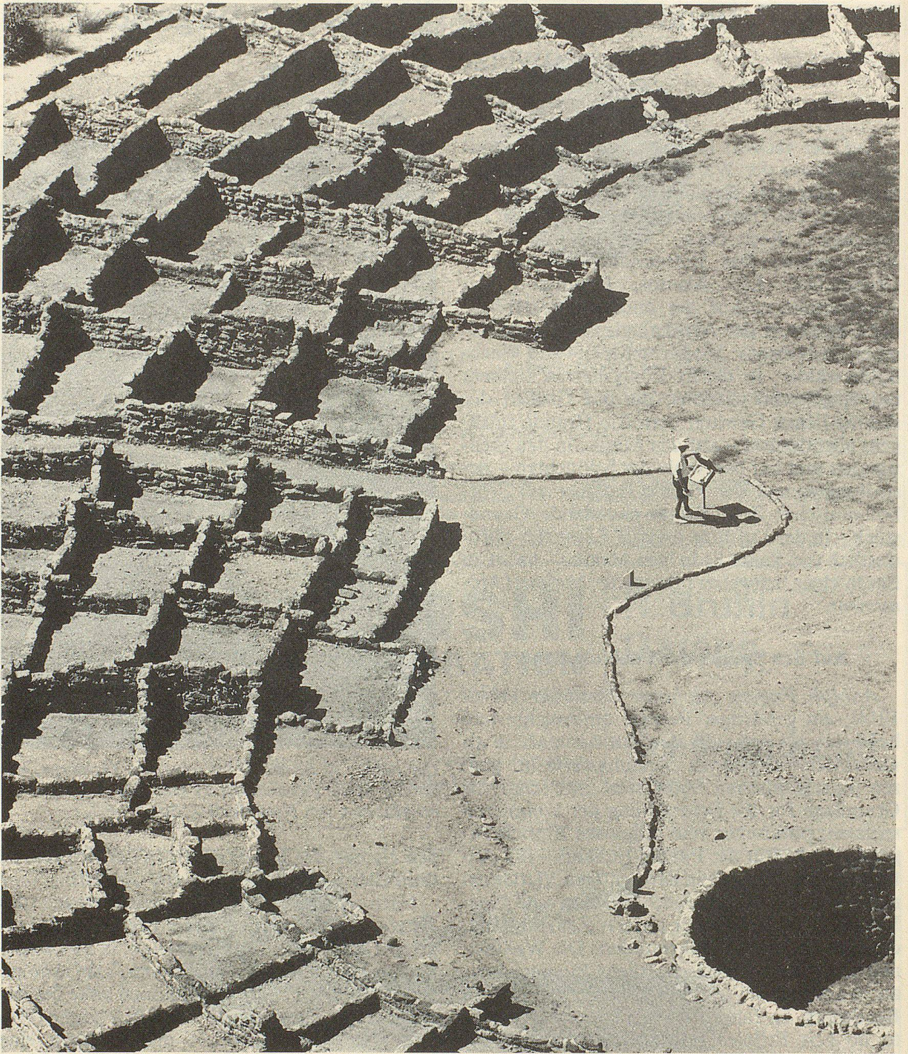
Tyuonyi, eine der eindrucklichsten Pueblo-Ruinen im Einzugsgebiet des Rio Grande. Von dem einst dreistöckigen 400-kammerigen Hausdorf ist heute nur noch wenig aufgehendes Mauerwerk des Untergeschosses sichtbar. Im Innern des Kreises die Kiva.