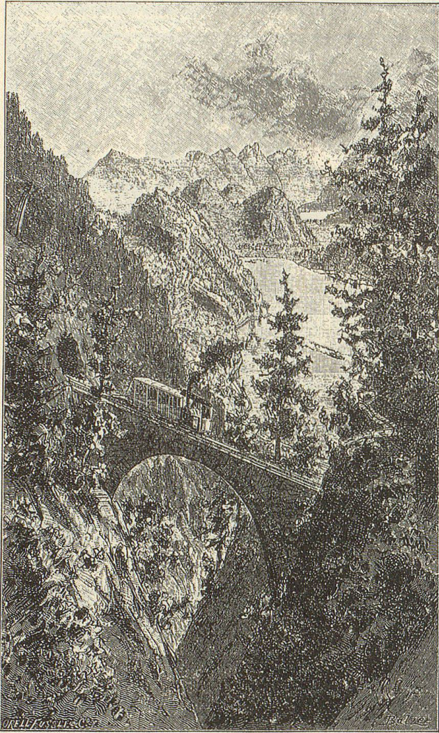
Wolfort • Viadukt.

(1890) Der 1890er Kalender berichtet über die Eröffnung der Pilatusbahn (Bild: Wolfort-Viadukt).