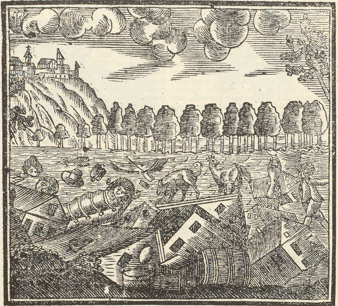
(1790) «Vorstellung wie der Nekarfluss in Deutschland viele Häuser, Hausmobilien, ja Kinder in der Wiege dahergeführt hat.»

zung zu Paris» ein: «Man hat kein Beyspiel in der Geschichte, dass eine Staatsveränderung in so kurzer Zeit zu Stunde gebracht worden sey. Paris hat nun ein Beyspiel gegeben, was eine Bürgerschaft vermag, auf gleichen Ton gestimmt königlichen Befehlen zu widerstehen. – Der Dienstag den 14ten Juli war es, wo man mit Erstaunen sah wie in Zeit von 2 mahl 24 Stunden, gegen 3 mahl hundert Tausend Bürger sich